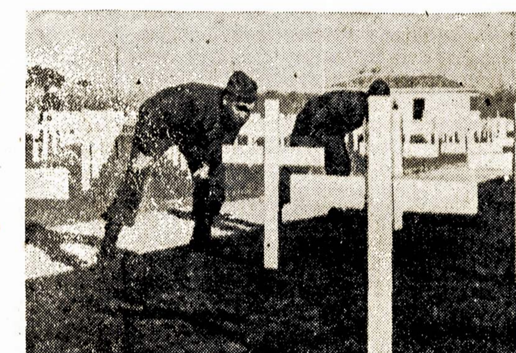
Ant kapinių, netoli Anzio, Italijoje, kur prieš keletą metų šimtai amerikiečių karių padėjo gyvastis, karščiau peržiūrėjai eiles kryželiu, jieškodami savo draugų kapo. Darbininkai kovoja dabar, kad išlaikyti demokratija, už kurį tie vaikai mirė.

New York. — Kovo 7 d. čia buvo rekordinė 71 laipsnio šiluma.