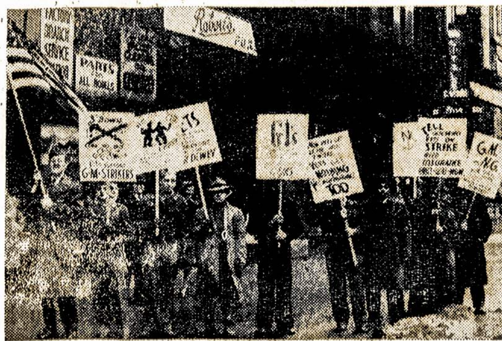
Tie veteranai, CIO nariai, pikietu prie nedarbo apdraudos raštinės, Buffalo, išreiškia savo nepasitenkinimą. Tam jie turi didžią priežastį. Išėjus į streiką prieš General Motors, jiems neduoda nedarbo apdraudos, kaip ji duodama už 7 savaitių darbininkams ne veteranams. O kaip veteranams iš ten pašalpa sulaukimo dėl to, kad jie nedirba dėl nesupratimo tarp darbininkų ir industrijos savininkų.