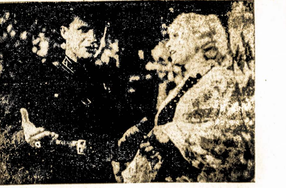
Eugene Samoilov ir Marina Ladynina dainuoja meilės dainą muzikališkoje Tarybų Sąjungos filmoje "Six P. M.", rodomoje Stanley Theatre, 7th Ave. ir 42nd St., New York'e.