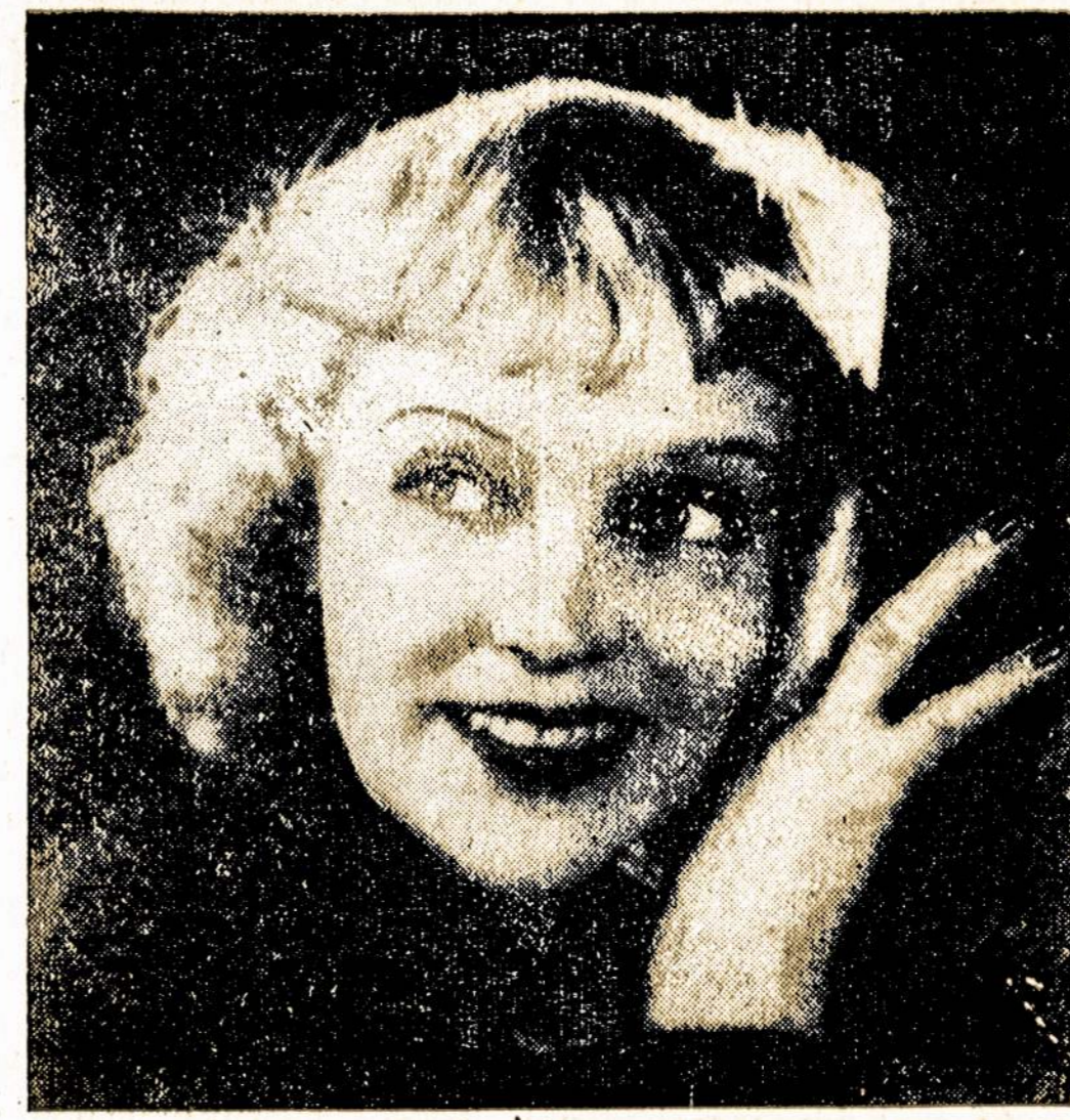
MARINA LADYNINA, dainuojanti Tarybų Sąjungos filmų žvaigždė, vaidina vadovaujančią rolę pirmu kartu Amerikoje rodomoj filmoj "Six P.M." Rodoma Stanley Theatre, 7th Ave. ir 42nd St., New Yorke.