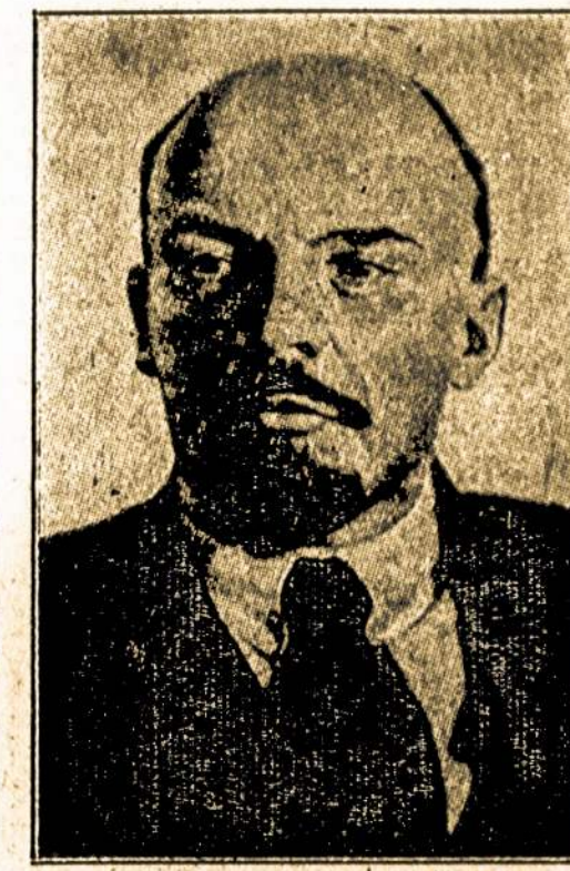
VLADIMIR L. LENINAS

Moterų Apšvietos Klubo metinis susirinkimas įvyks sausio 17-tos vakaro 8 val., 419 Lorimer St., Brooklynne. Raporai: iš metinio veikimo, iš apskrities konferencijos, iš registracijos krūtinės X-Ray emimui, rinkimas atstovės ir Laisvės suvažiavimą ir kiti reikalai. Valdyba.