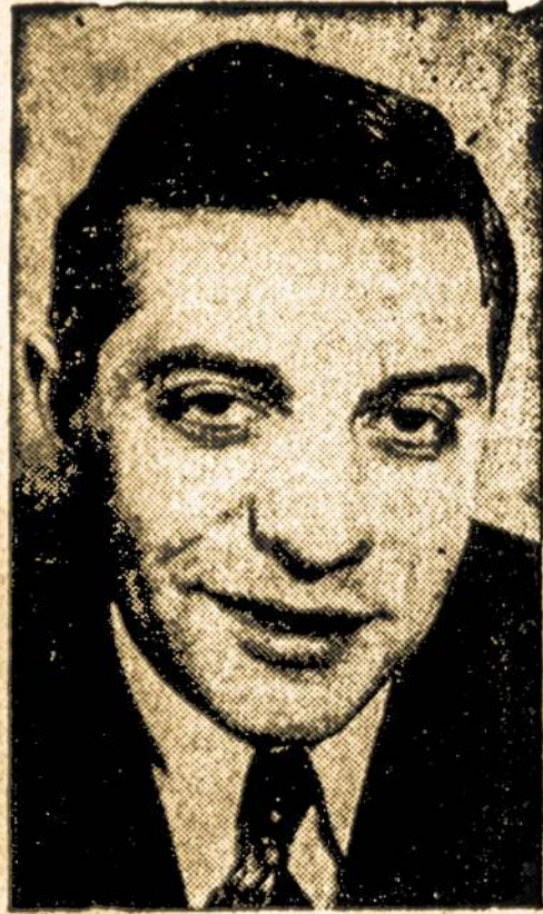
VITO MARCANTONIO, čempionas veiklos už Puerto Rico nepriklausomybę

Sausio 5-tą, Essex House, New Yorke, per visą dieną vyks konferencija, kuri, kaip sakoma, saukime, svarstys "portorikiečių teisę į laisvę." Konferencijos reikalais rūpinasi Council for Pan American Democracy, 23 W. 26th St., New Yorke.