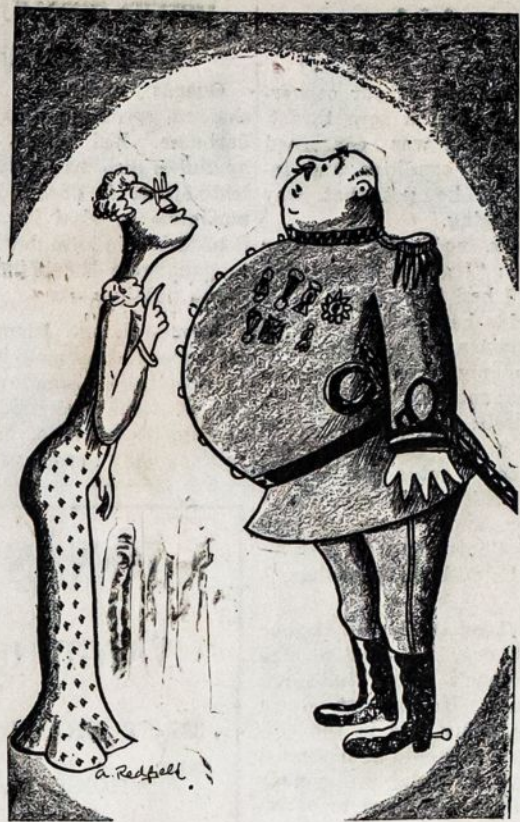
Panelė klausia Argentinios diktatorių: "Argi jums nesmagu, ponas generole, kad jūs Argentinoje turite demokratiją?"