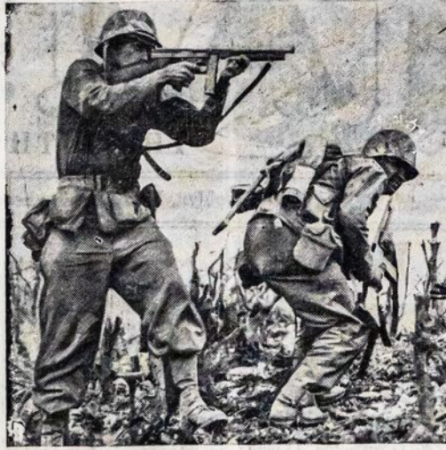
Mūsų kovūnai Okinawoje.

Gaila, kad gen. Ho Ying-Chin visai tuo klausimu nieko nesakė. O jis turėjo ką nors sakyti, nes plačiau numatančioji Amerikos visuomenės dalis nekant- rauja.