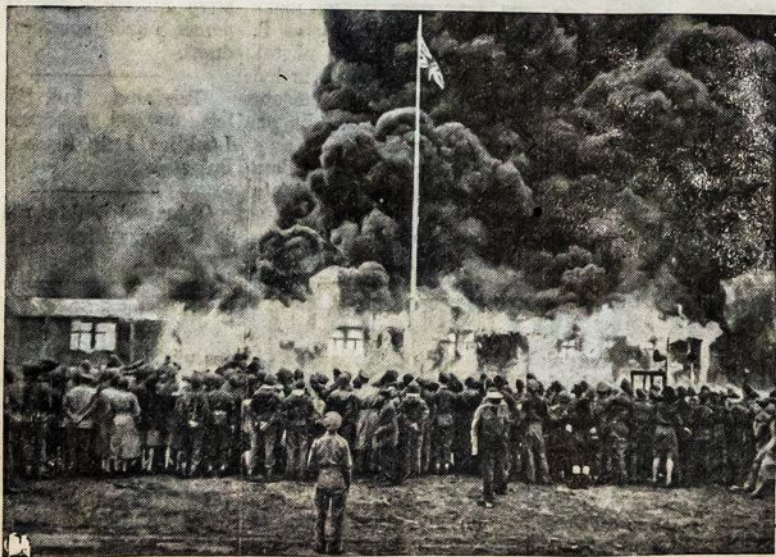
Ugnimi sunaikinta baisioji nacių stovykla mieste Belsen. Anglai stovyklos pastatus padegė, o daugybę stovyklos inamių, kurių naciai nespėjo nužudyti, paskutinį kartą žiūri į savo kentėjimų buveinę.