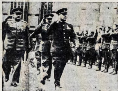
Cechoslovakijos sostinėje Pragoje. Tarybų Sąjungos karininkai, maršalas Konev ir generolas Yeremenko inspektuoja išlaisvintos respublikos gvardiją prie prezidento Benešo rūmų.

Manila, birž. 28. — Amerikiečiai jau visai išvadavo nuo japonų Luzoną, didžiausią ir svarbiausią Filipinų salą, kaip pranešė generolas MacArthuras. Ta 40,420 ketvirtinių mylių sala tapo atkariauta per 5 mėnesius ir 19 dienų nuo amerikiečių įsiveržimo iš Lingayen įlankos į Luzoną sausio 9 d. Vien šiauriniame Luzono ruože, ypač Cagayan klonyje, Amerikos kariai per 28 dienas užmušė 113,593 ja-