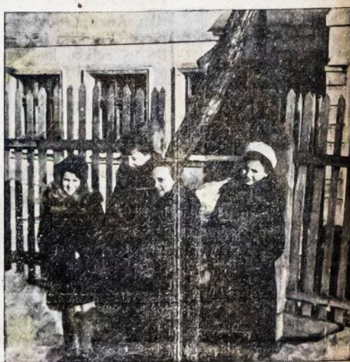
Grupė Kievo vaikų, prieglaudos namo įnamy, apsirengusių amerikietiškais šiltais rūbais.