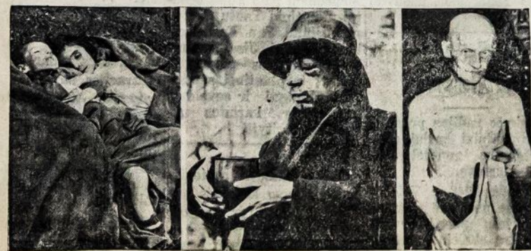
Belsen koncentracijos stovyklos vaizdai. Kairėje pusėje du vaikai mirę badu; viduryje — darbininkas, kuriam naciai truperiai sudaužė veidą; dešiniame gale išlaisvintas lenkas darbininkas bando iš savo drabužių utelės išvalyti.

buvo giliai palėpyj. Sunku buvo Vokietijos komunistams darbuotis tuomet, kai hitlerininkams sekėsi karinės avantūros, kai viena šalis po kitos perėjo jų „globon”, kai demokratiniai-buržuazinių šalių valdovai jiems lenkėsi ir visaip padėjo įsigalėti!