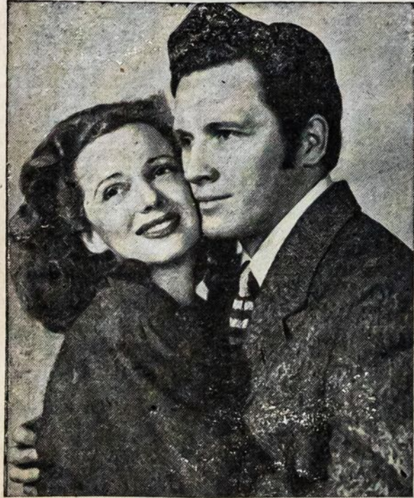
Jan myli John muzikališkame Teatro Gildijos veikale "Carousel," statomame scenoje Majestic Theatre, 44th St. (j vakarus nuo Broadway), New York. Gražuolė Jan Clayton su taip pat ne prastu John Raitt vaidina meiluzių rolėse. Veikalui muziką pagamino Richard Rodgers, veikalą ir eiles — Oscar Hammerstein 2nd, žokius — Agnes de Mille. Perstatymų vadovauja Ruben Mamoulian.