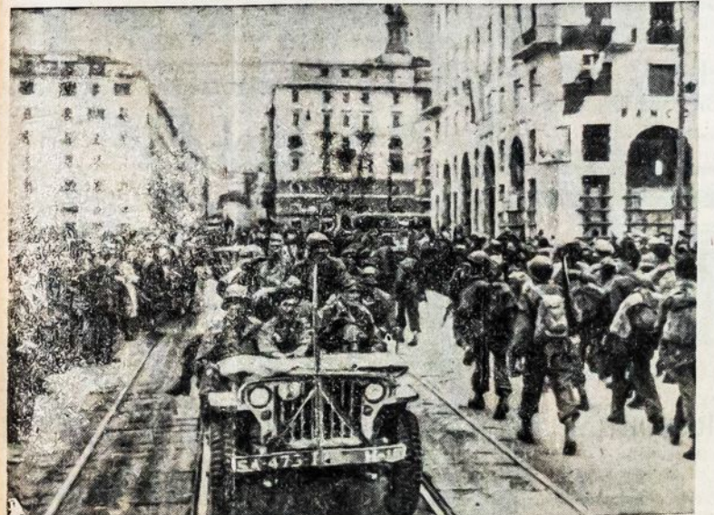
Amerikiečiai pergalingai žygiuoja Italijos miesto Genoa gatve. Iš miesto naciai ir italai fašistai buvo išmušti suvienytomis pastangomis amerikiečių ir italų partizanų.