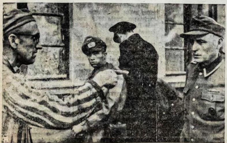
Tarybų Sąjungos pilietis, išlaisvintas iš nacių vergijos, sutiko ir pažino nacių budių, kuris belaisvius muše ir kankino. Jis į nieką rodo pirštu. Aišku, kad šis nacių buvo sumistas ir įtrauktas į kriminalistų surašą.

Paryžiaus radijas pranešė, jog kariniai talkininkai sekliai užtiko daugelį vokiečių ginklų ir sproginių sandėlių, kurie buvo paslėpti kalnuose ir miškuose pietinėje Vokietijoje, Čechoslovakijoje, Vengrijoje ir Lenkijoje. Hitlerininkai tuos pabūklus skyrė vadina, miem savo “vilkžmogiam”, kuriem įsakyta iš pasaly užpildinėti ir žudyti talkininkų karius ir valdininkus.