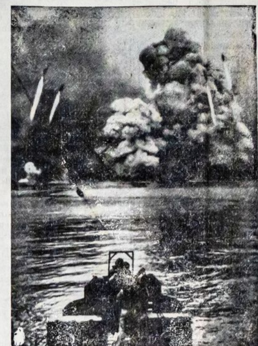
Amerikiečių karinis laivas apšaudė japonų laikomą uostą Tarakan pirmą, negu ten kelsis mūsų kovūnai.

Iki pastarojo laikotarpio Amerikoje apie 700,000 žemės ūkių vartojo elektrinę jėgą.