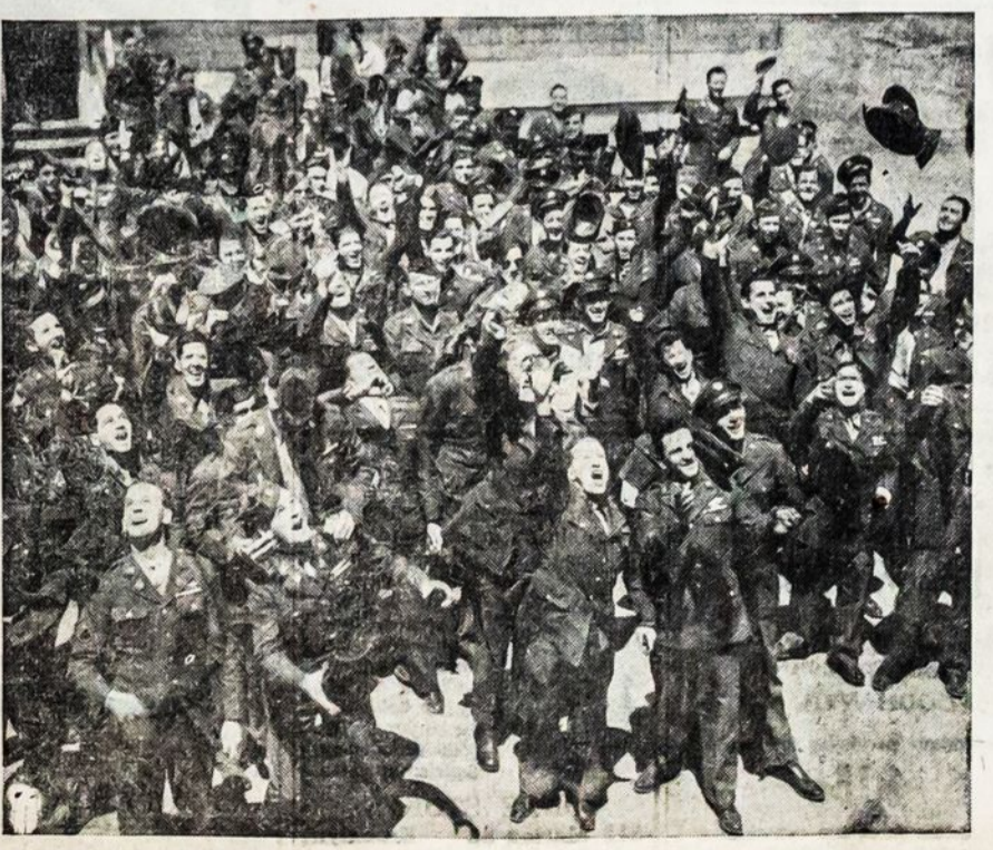
Pirmoji grupė veteranų, kurie tapo atleisti iš armijos. Jie džiaugiasi ir didžiuliais užsitarnavę sugrįžti į civilinį gyvenimą. Paveiklas trauktas Fort Dix, N. J.