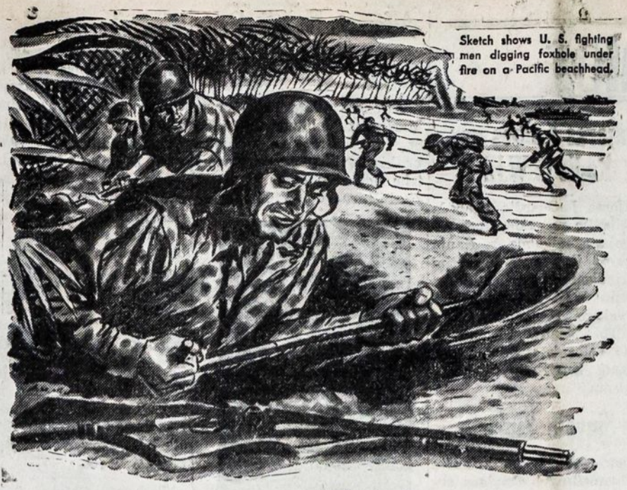
Sketch shows U. S. fighting men digging foxhole under fire on a Pacific beachhead.