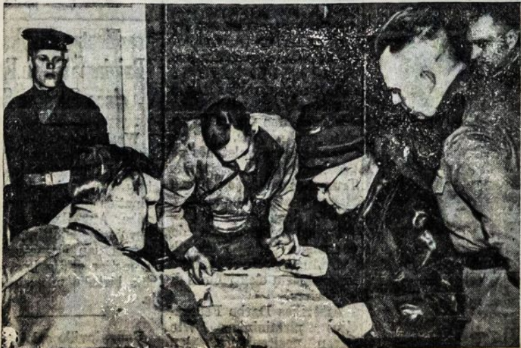
Armijoms besitartinant vienai prie kitos, Tarybų Sąjungos ir Amerikos armijų viršininkai laikydavo bendrus pasitarimus ir veikė pagal bendrą planą.