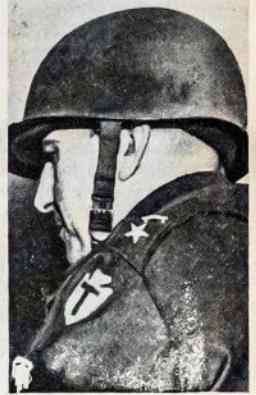
Generolas R. J. Stack (vir- šuje) ir generolas John E. Dahquist, į kurių rankas pa- teko kriminalistas Goeringas ir kurį jie gražiai priėmė ir pa- vaišino. Visas pasaulis tuomet pasipiktino ir gen. Eisenhower viešai turėjo pasmerkti to na- cio lyderio švelnų glostymą.