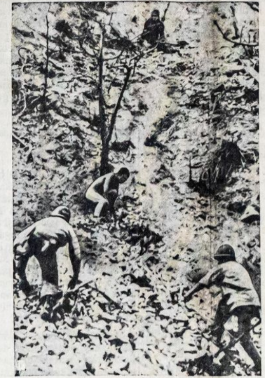
Kur nors ant Filipinų salos amerikiečiai apsupo šį japoną. Kad užsitikrinus, jog jis nepabėgs, jam įsakyta visiškai nusirengti.