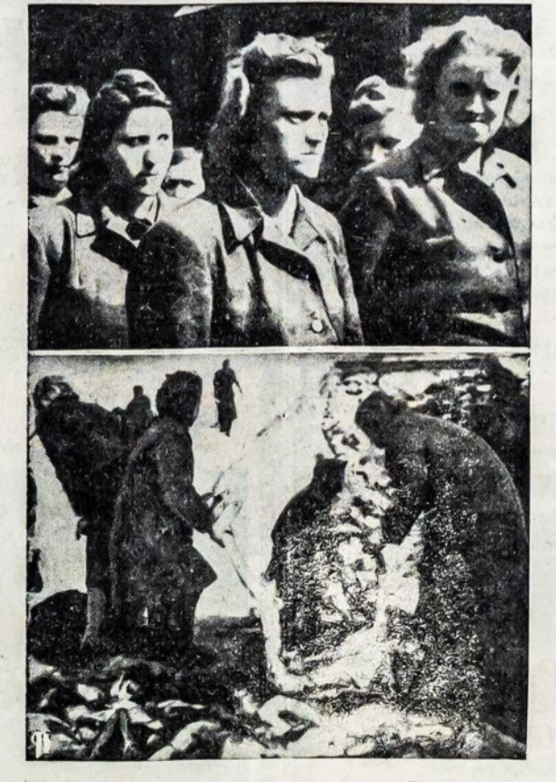
Brutališkumas tarsi raštu išrašytas veiduose tų moterų nacių SS sargybinių Belsen koncentracijos kempės. Jų žiaurumas, sakoma, pilnai prilygdavęs žiaurumui nacių vyrų. Apatiniame paveiksle matome, kaip tos paties moterų, Anglijos armijos įsakytos, nerangiai atrenka savo žiaurumo aukų kūnus iš bendros duobės palaidojimui jų atskiruose kapuose.