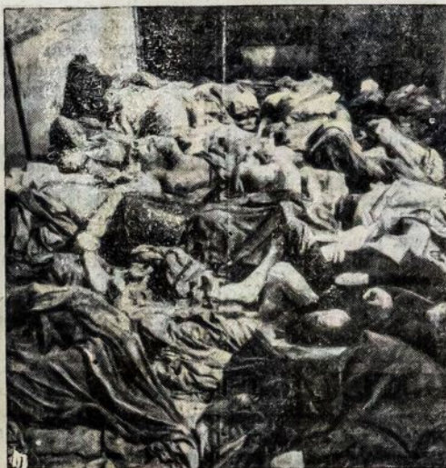
Vaiždas iš Dachau kempės Vokietijoje, kurioje amerikiečiai rado krūvas nukankintų žmonių lavonų. Kempėje taipgi rado vagonus, pilnus lavonų. Čia parodomasi tikrai vienas tokių vagonų.