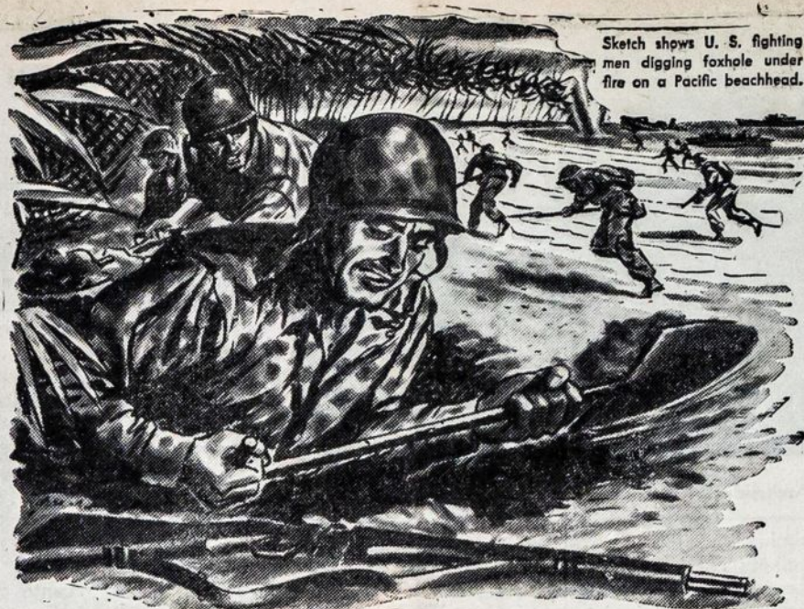
Sketch shows U. S. fighting men digging foxhole under fire on a Pacific beachhead.