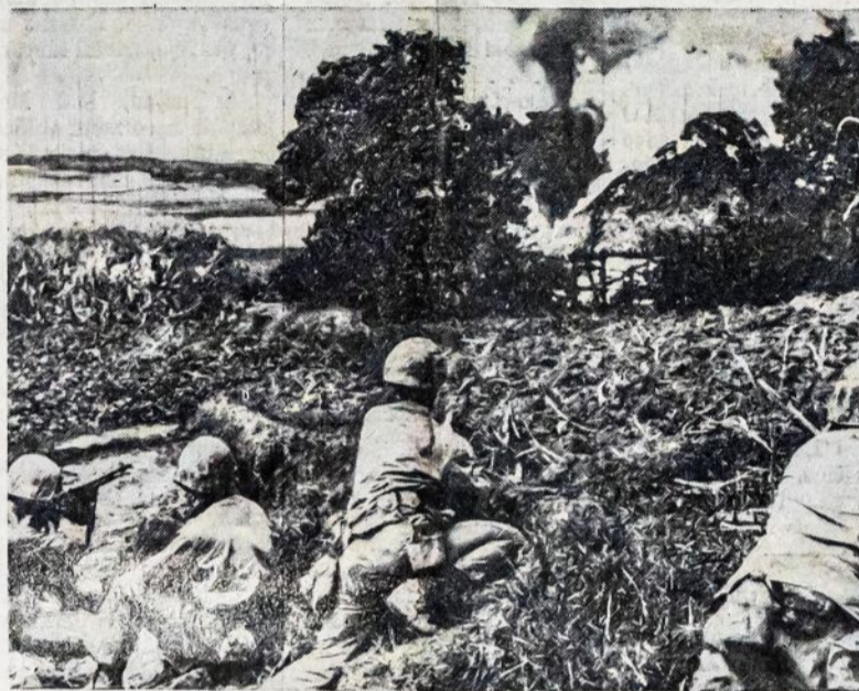
Amerikiečiai kovūnai ant salos Okinawa. Čia matosi, kaip jie padegė japonų būdą ir laukia iš jos japonų išlendant.

Guam, geg. 17. — Daugiau kaip 500 galingiausių Amerikos bombonešių B-29 praeitą naktį paleido 3,500 gaisrinių bombų į Nagoyą, trečią didžiausią Japonijos miestą, ir vieną šiuo žygiu išdegino 16 ketvirtinių mylių fabrikinėje Nagoyos dalyje, svarbiausiame Japonijos orlaivių statyklų centre. Jankių bombos užkūrė didžiausią japonų lėktuvų fabriką Mitsubishi, ginklų ir amunicijos dirbklas ir prielaukų įrengimus. Tai buvo antras didis amerikiečių oro žygis per tris dienas prieš Nagoyą, pusantro milijono gyventojų miestą. Jankių lakūnai sakė, didžioji didžiama Nagoyos jau sunaikinta.