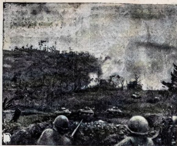
Amerikiečiai kovūnai ant Okinawa salos.

Kuomet kalbu apie pasisekimą gyvenime, atsiekimą aukščiausio tikslo, nebus pro šalį parekomenduoti jums, kad perskaitytumėt šias knygas: "A Treasury of Science" by Dr. Harlow Shapley; "100 Great Lives" by Allen. Grįšiu vėl prie farmacijos. Dabar gera proga pradėti farmacijos mokslą, nes yra didelis trūkumas farmaceutų Amerikoje. Ši proga tinka kaip dėl berniukų, taip dėl mergaičių.