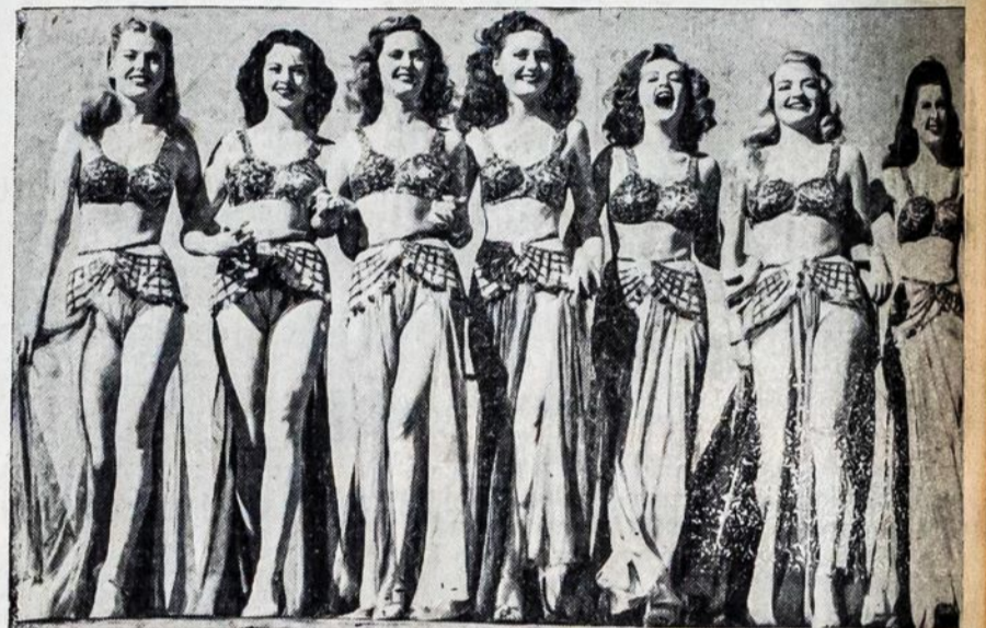
Grupė gražuolių iš filmo "Salome, Where She Danced," rodomos Loew's Criterion Theatre, Broadway ir 45th St., New Yorke.