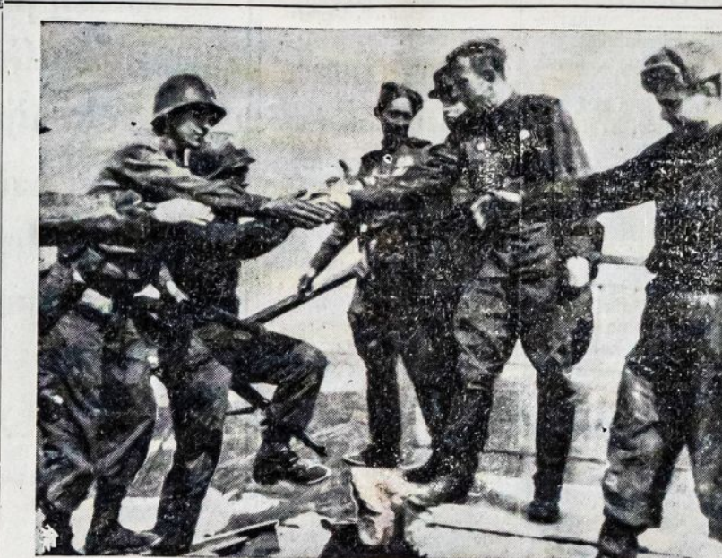
Amerikos ir Sovietų kariai, pagaliau, susijungę, sveikinasi per pralaužtą tiltą virš Elbos upės ties Torgau miestu, Vokietijoje. Šis istorinis amerikiečių susitikimas su raudonarmiečiais perskėlė vokiečių jėgas ir privedė nacių prie greito besąlyginio pasidavimo talkininkams.

Kalėjime jis pradėjo rašyti savo knygą "Mein Kampf", tapusią nacizmo biblija. Išėjęs iš kalėjimo,