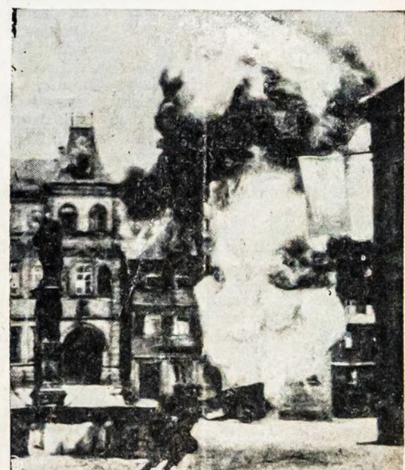
TWO ANTI-TANK INFANTRYMEN OF THE U. S. Third Army's 26th Division, dash past a blazing German gasoline cart in Kronach, Germany. The town is 35 miles west of the Czechoslovakian border.