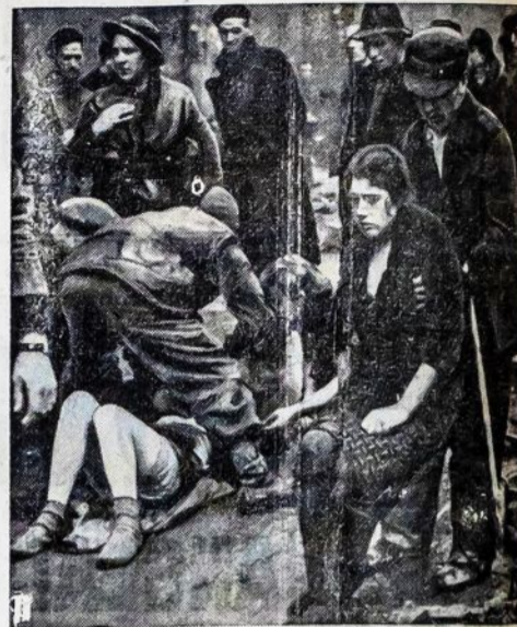
Baisūs vokiečių nacių darbai. Kempėje Osnabrucke budeliai pamatė, kad jiems ateina galas, tai sugrįdo Tarybų Sąjungos atvežtuosius vergijon civilinius žmones į namą ir padegė. Dar laimė, kad tuo tarpu buvo Anglijos armija ir spėjo nors keletą tų žmonių rasti gyvais ir išlaisvinti. Paveiksle parodoma, kaip prietrokusiuosius anglai stengiasi atgaivinti.