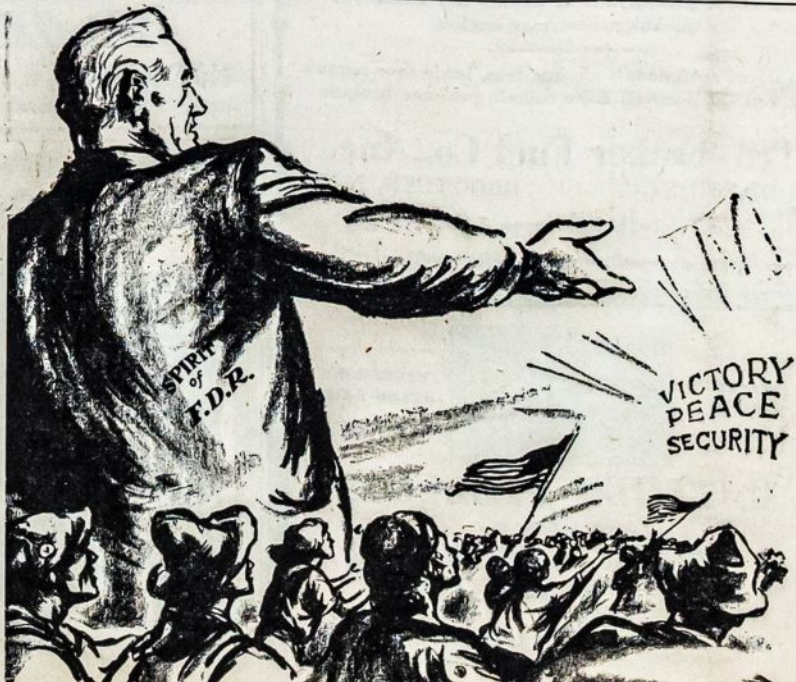
Nors prezidentas Franklin Delano Rooseveltas mirė, bet jojo dvasia, jo nustatytos gairės, jojo palikimas teberodo Amerikai kelią į pergalę, taiką ir saugumą.