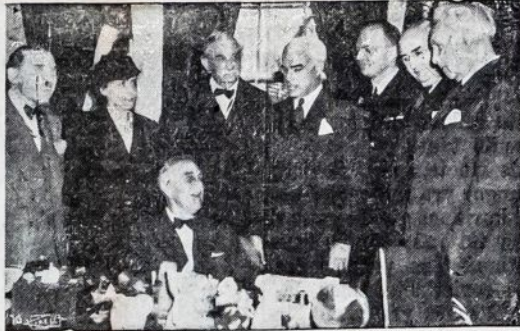
Prieš trejetą dienų prieš mirtį pas Rooseveltą buvo atsilankiusi Jungtinių Valstijų delegacija į Jungtinių Tautų konferenciją. Jis nesitikėjo, kad nebesulauks to didžio tarptautinio sąskridžio, kurio suruošimui jis tiek darbo buvo padėjęs...