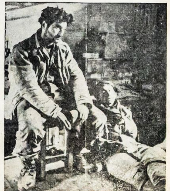
Karas yra sunkus, varginantis darbas. Čia parodomi du tipiški amerikiečiai po sunkaus žygio karo fronte.

Gen. Pattonui Austrijoje telieka 38 mylios susisiekti su Raudon. Armija.