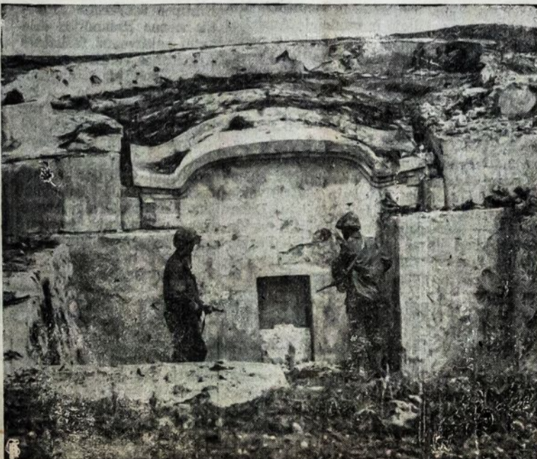
Du amerikiečiai ant salos Okinawa jieško japonų, pasislėpusių mūrinėse olose, kuriose laidojami japonai didžiunai.

Konferencijai besitariant, kai kurie bando sudaryti kokį išpūdį, jog iš viso propaustuojama organizacija bus įsteigta vyriausiai tam, kad galėtų suvaldyti Vokietiją, kuri šiuo šimtmečiu jau pradėjo pasaulinius karus. Girdi, reikia Vokietiją pažaboti taip, kad daugiau ji nebegalėtų Ameriką į kokią nors tautų lygą, nors ta lyga būtų bereikšmė. Sakoma, kad Roosevelto svajonė buvo tapti viso pasaulio prezidentu. Šitie internacionalistai gerai supranta, kad po karo Amerikos ir tautų lyga nebus galima įtraukti, kaip nebuvo galima to padaryti po