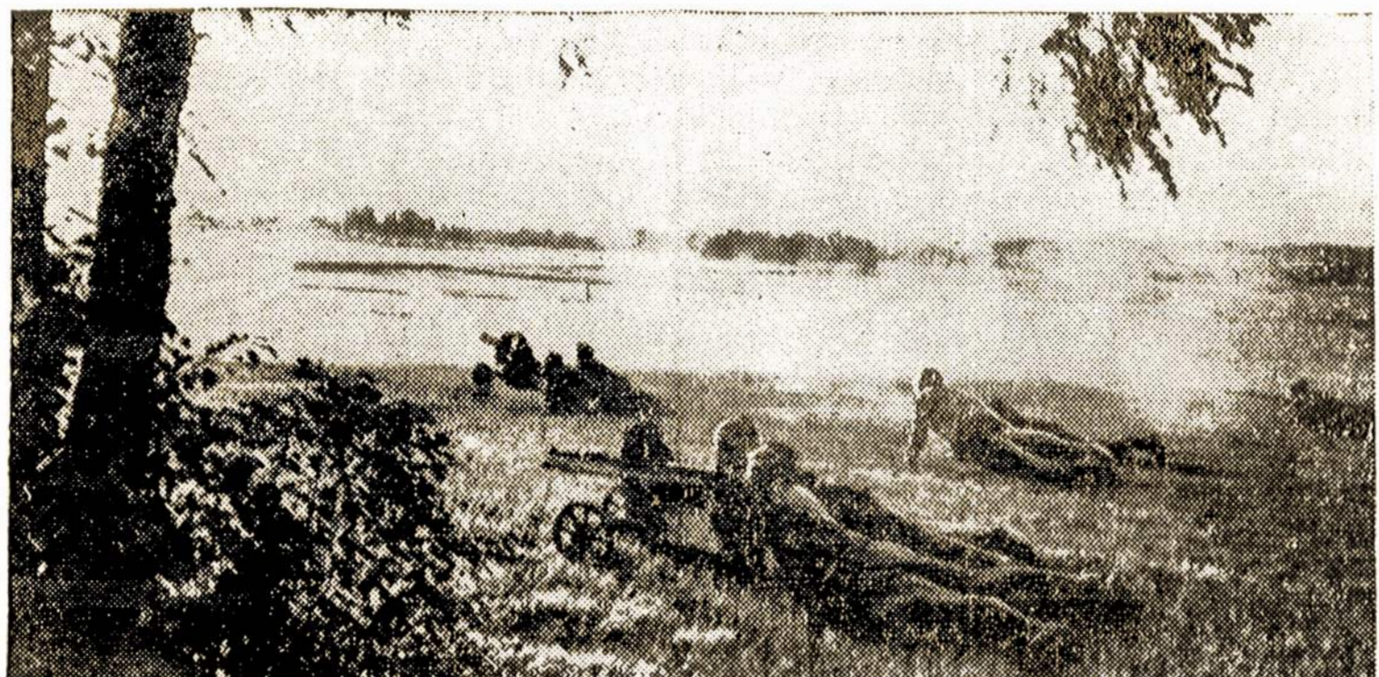
Raudonoji Armija m uša vokiečius prie pat Rytinės Prūsijos rubežiaus.