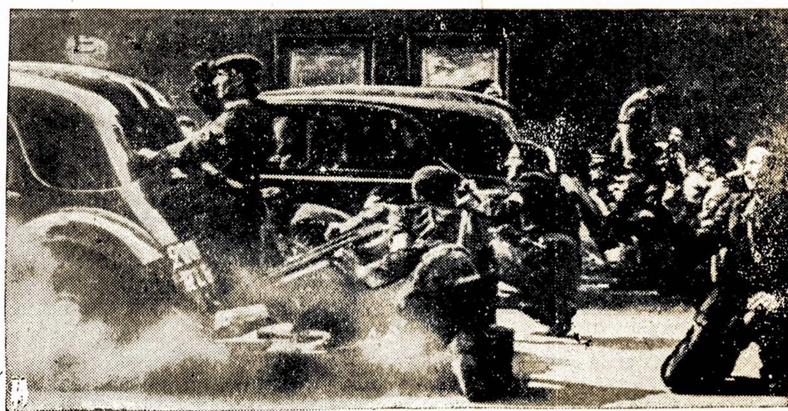
Ši scena pasikartojė daugelyje Paryžiaus gatvių. Tai savo tėvynę laisvinantieji francūzų būriai kertasi su naciais ir francūziškais fašistais snaperiais.

Lavintis, šviestis niekad nėra pervalu. Skaitykite geras knygas.