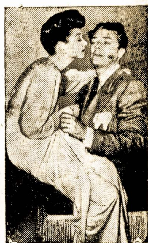
Rosalind Russell ir Brian Aherne naujame komikame romanse "What A Woman," Brooklyno Paramount Theatre.