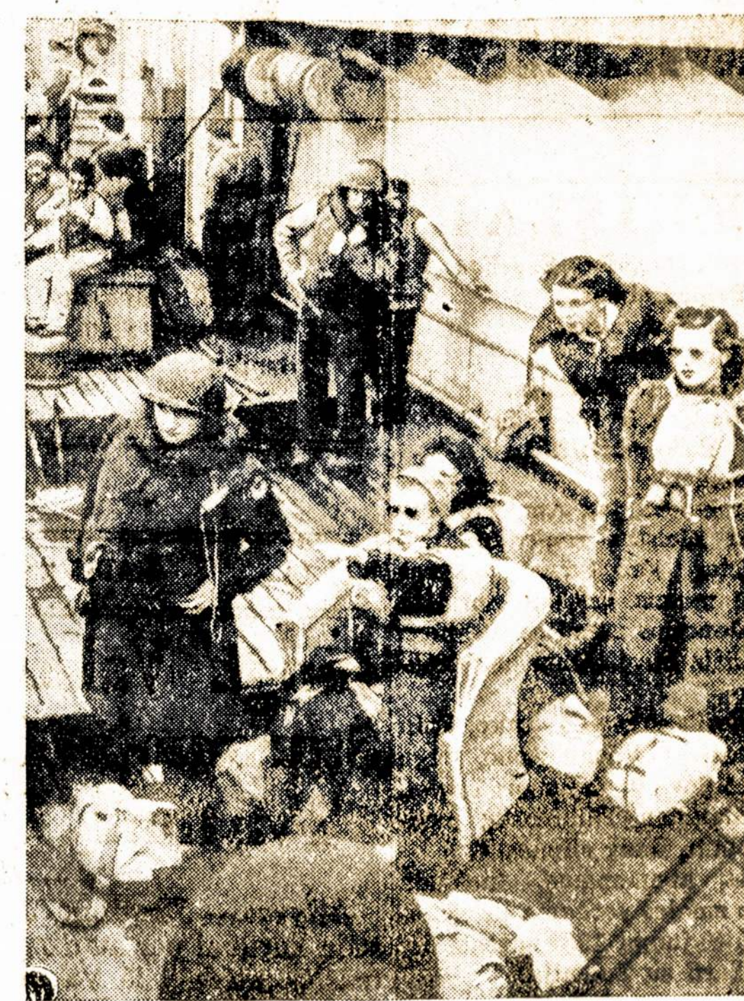
Paveikslas Darytas ant vieno Jungtinių Valstijų transportinio laivo laike submarino atakos. Tai tikrai dramatiška scena. Raudonojo Kryžiaus slaugė rodo j tą vietą, kur buvo pastebėtas submarinas. Submariną pavyko nuvaikyti pirma, negu jis galėjo paleisti torpedą ir laivą nuskandinti.

Dorie Miller ir Butch O'Hare yra dingę. Tačiau jų gyvybės įrodė, ką vyrų drąsa reiškia kitiems. Lakūnas, kuris pažinonojo O'Hare, taip apie jį pasakė: “Nežiūrint mūsų galin-