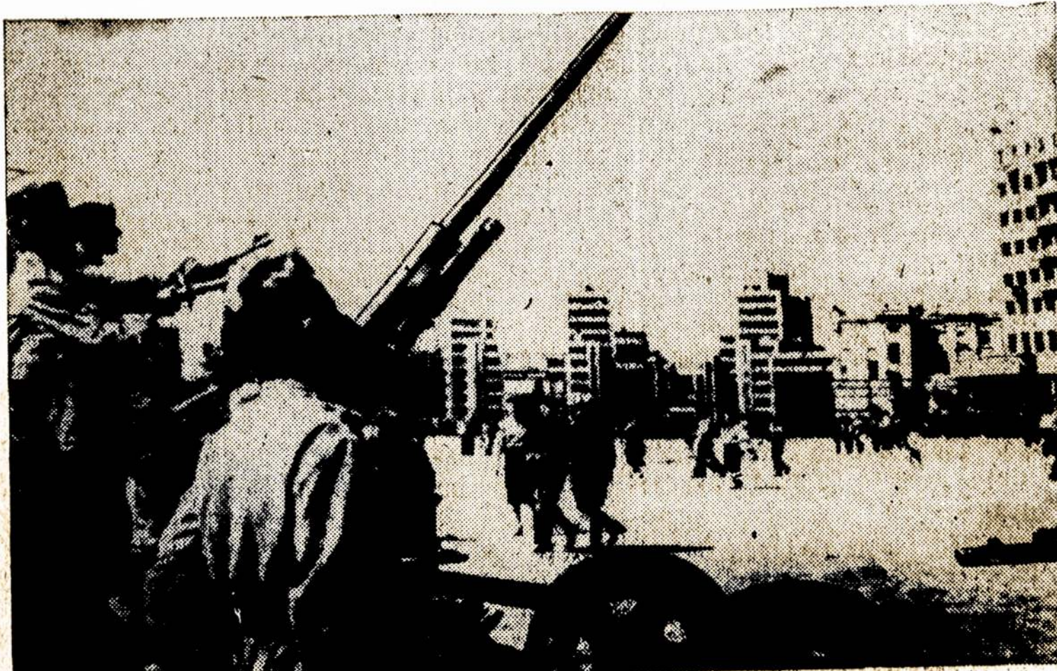
Raudonoji Armija būdi ir saugo Čarkovą, iš kurio jie išgrūdo vokiečius plėšikus. Raudonarmiečiai didžiuojasi atkariautu miestu, nors jisai tapo vokiečių apiplėštas ir beveik visai sugriautas.