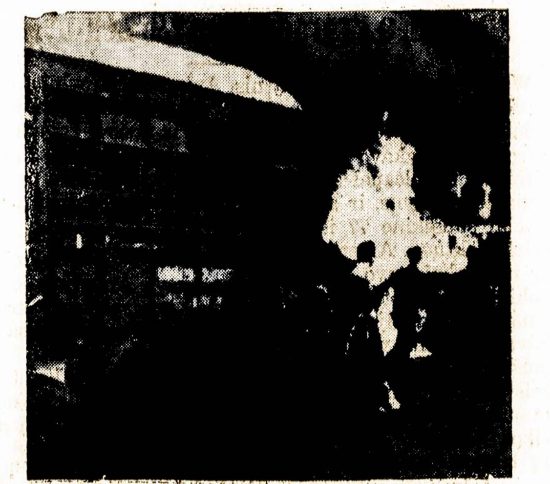
Vaidzas iš Argentinos "revoliucijos," neseniai įvykusios: busas dega Plaza de Mayo aikštėje, o žmonės maršuoja gatvėmis.