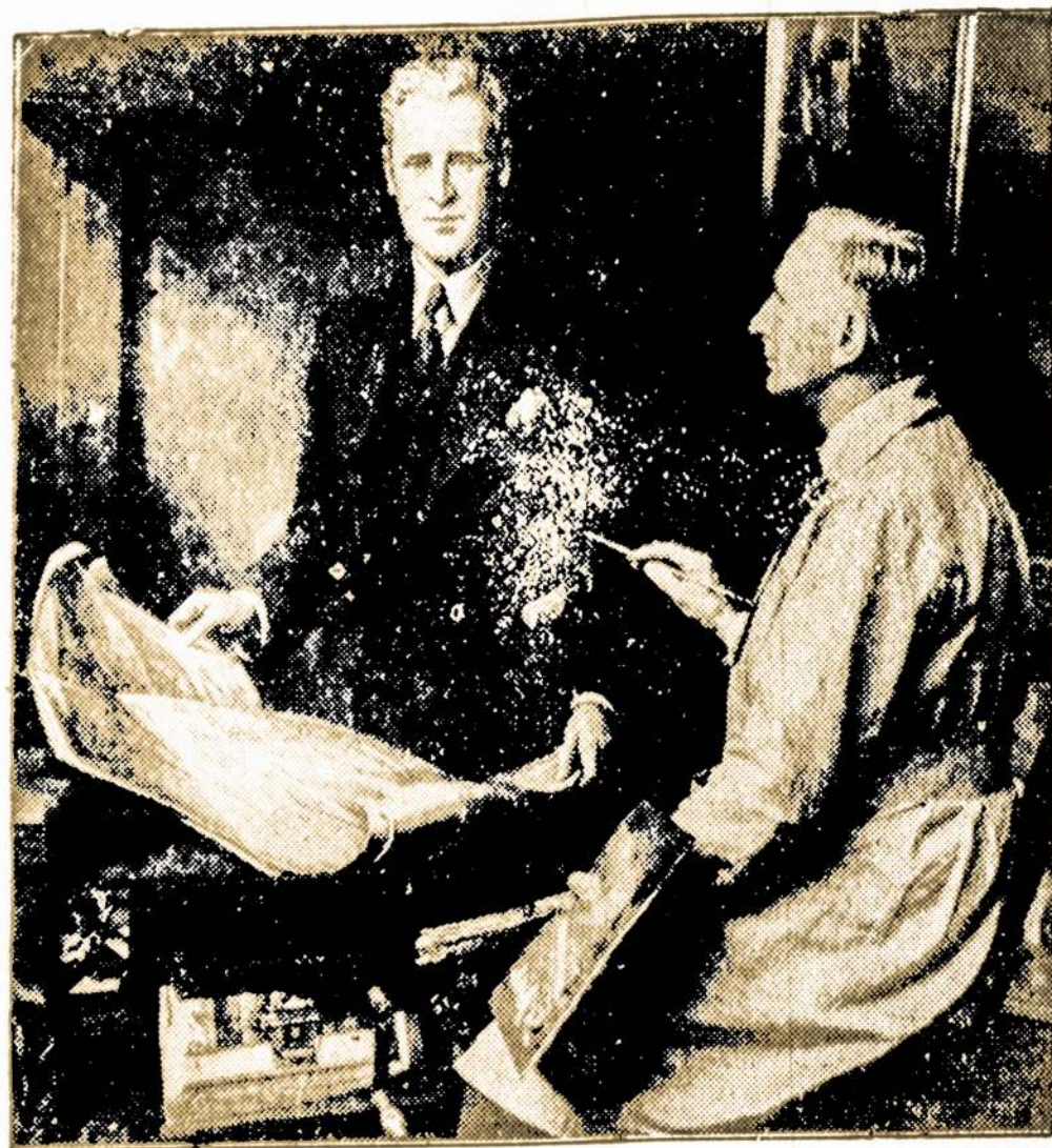
Scena iš filmos "Spitfire", rodomos Rivoli Teatre, Broadway, tarp 49th ir 50th Sts., New Yorke.

Šešiolikos metų vaikinėlis Brooklyne pasiūstas į Elmira pataisų namus už vagiavimą nakčia po krautuves. Pagelbininku jis turėjęs 15 metų jaunuolį.