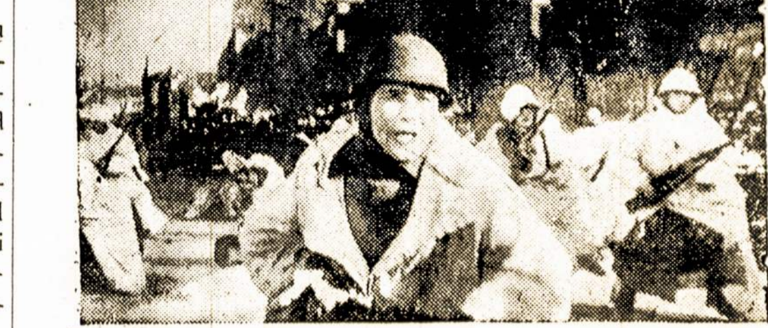
Paveikslas iš Sovietų judžio "Mashenka," pirmu kar tu Amerikoje sekmingai rodomo Stanley Teatre, 7th Ave. ir 42nd St., New Yorke. "Mashenka" skaitoma viena iš išpūdingiausių filmų po "Merginos Iš Leningrado."