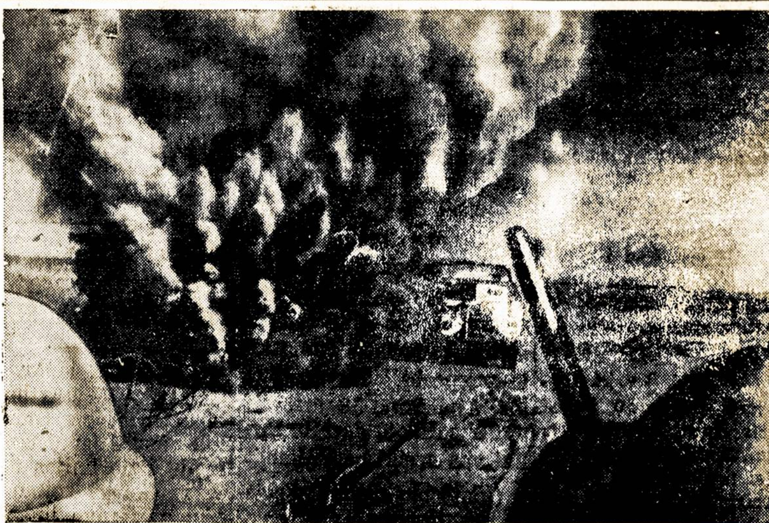
Vaizdas iš karo Libijoj, kur anglai su savo talkininkais smarkiai muša vokiečius.

Ką mes galime patarti, tai kad jis tuojau dabar nueitų minėton įstaigon ir pasiteirautų, kame dalykas, kodėl iš jo reikalaujama tų taksų. Gal pavyks dalykus išaiškinti ir valdininkus įtikinti, kad jie yra padarę klaidą.