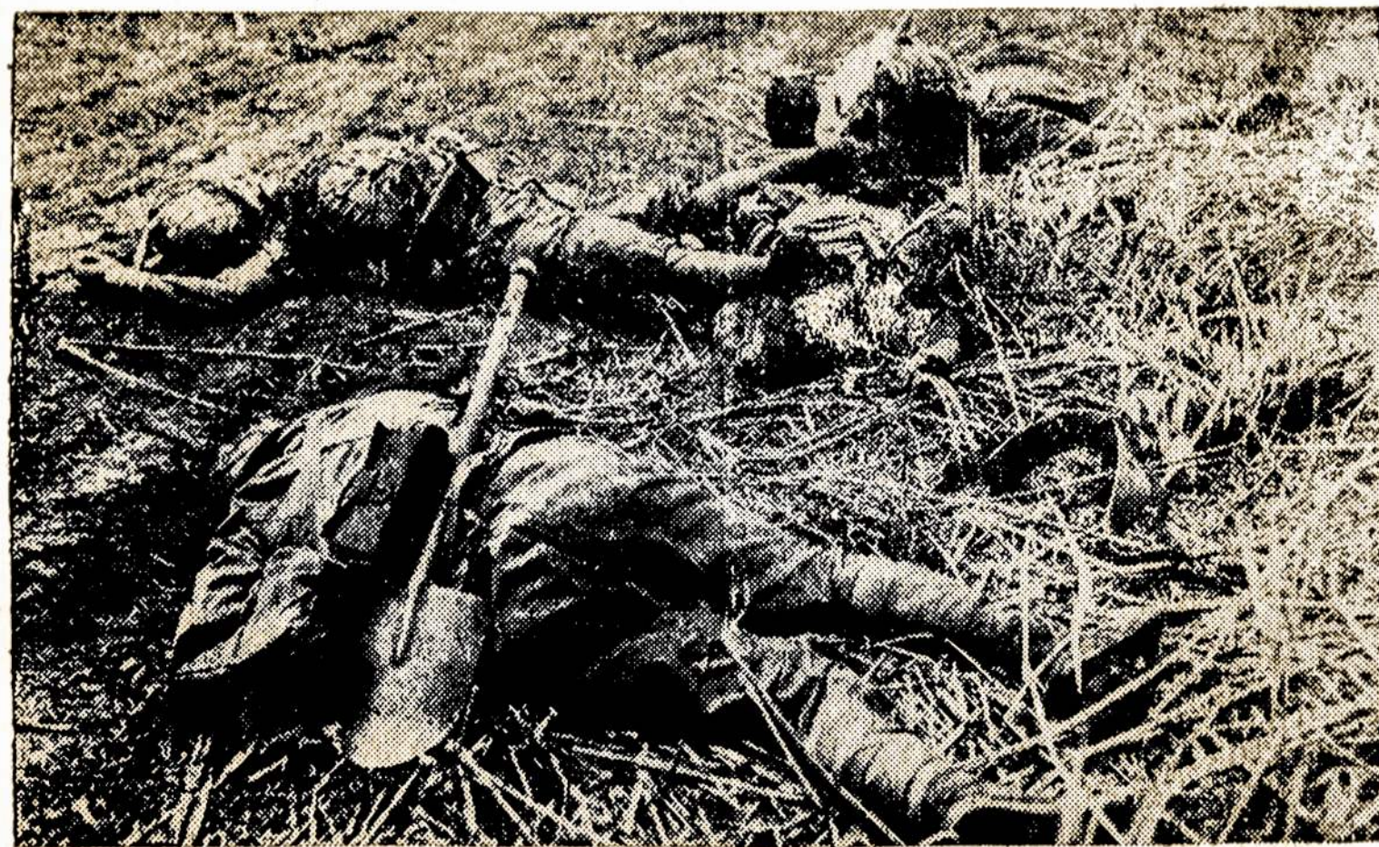
Vaidas iš Saliamono salų, Ramiajame Vandenyne; keletas japoniškų karių kritę nuo amerikiečių kulčių.

Kai kuriems iš mūsų atrodo, jog Ai-do Choro gyvavimo 30-šimts metų labai skubiai, nesulaikomai prabėgo ir paliko mumis kokiame tai giliame nusiminime, lyg kad būtume ką blogo padarę. Bet