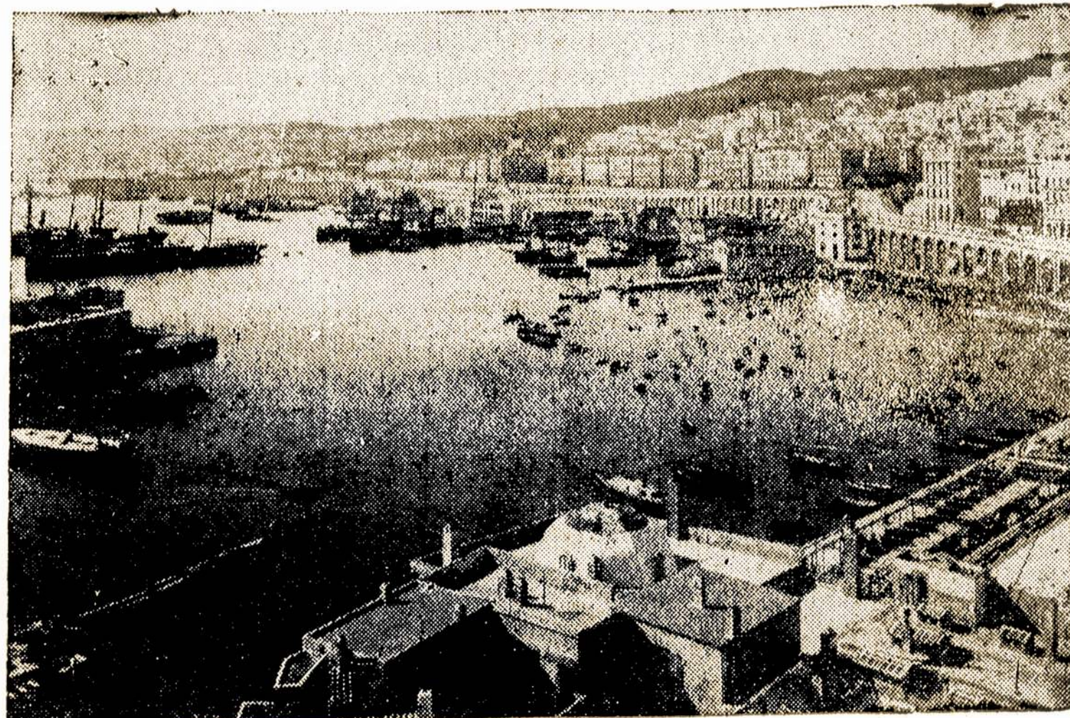
Miesto Alžyro (Algiers) uostas šiaurės Afrikoje. Alžyras buvo pirmutinis miestas šiaurės Afrikoje, pasidavęs amerikiečiams.

Tai koks tikslas to Chicago melagiaus keturiais sykiams sumažinti skaitlines? Jei gi melas nebūtų virtęs jo ant-rąja prigimtimi, tai jis juk žinotų, kad tik save pasinie-kina šitaip meluodamas.