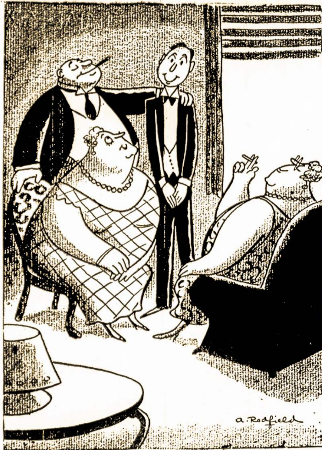
Cuthbert's Studying to be a Military Expert