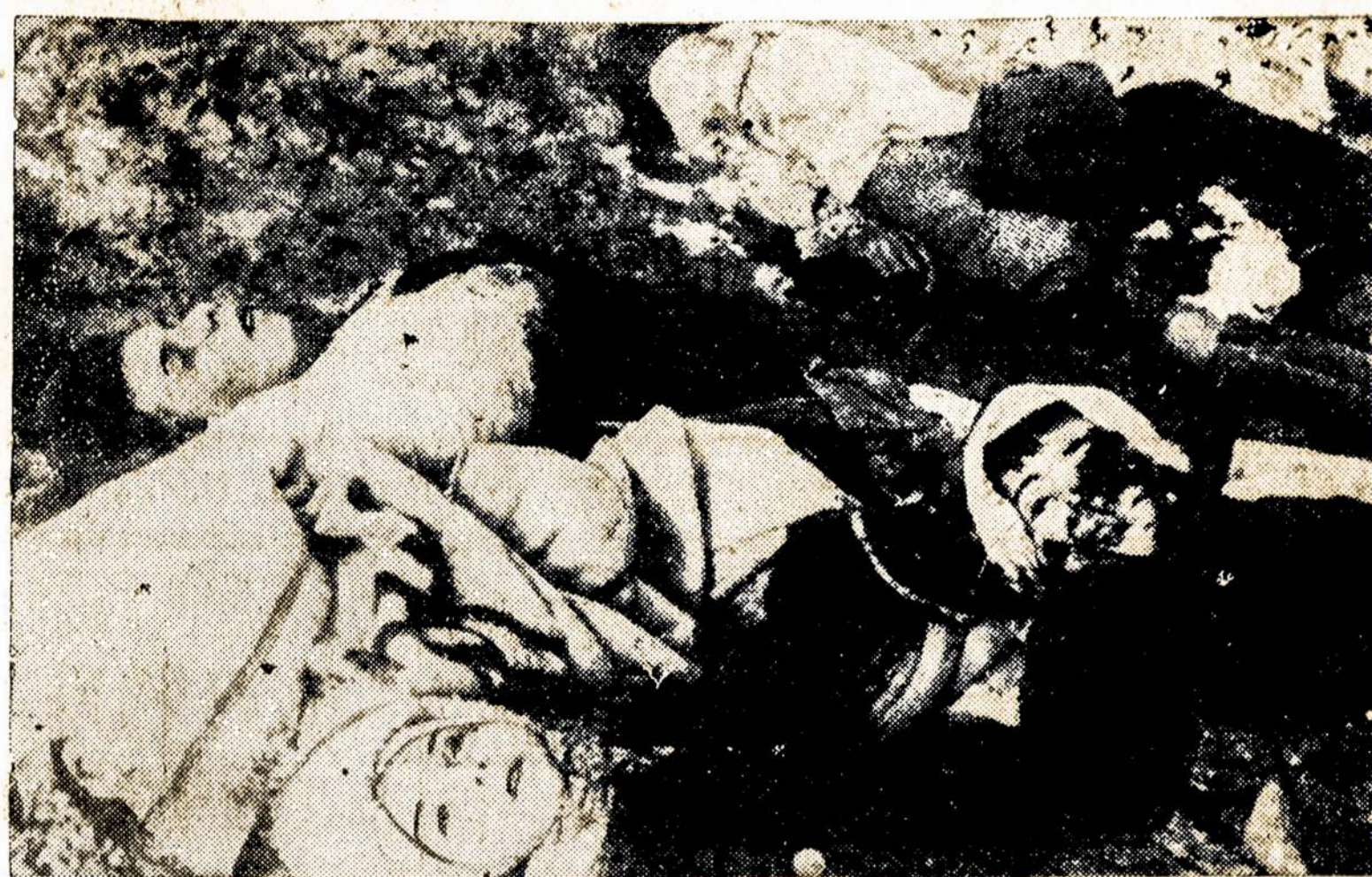
Kūnai moterų ir vaikų, kuriuos vokiški barbarai nužudė Kerfėjuje. Krimo pusulyje. Iš viso ten buvo nužudyta 7,000 žmonių. Tokių vaizdų Raudonoji Armija suvaidina daugybę tose vietose, kurias atkariauja iš vokiškų nacių.

Jeigu Java žlugtų, ypač jei ji žlugtų su mažais japonams nuostoliais, tuomet Jungtinėms Tautoms Ramiajame Vandenyne padėtis žymiai pasunkėtų. Mes trokštame, todėl, kad Java atsilaikytų, kad japonai jos negalėtų paimti; kad tie japonų kariai, kurie jau tapo iškelti į Javą, ten ir pasilikytų, bet tik kaip belaisviai.