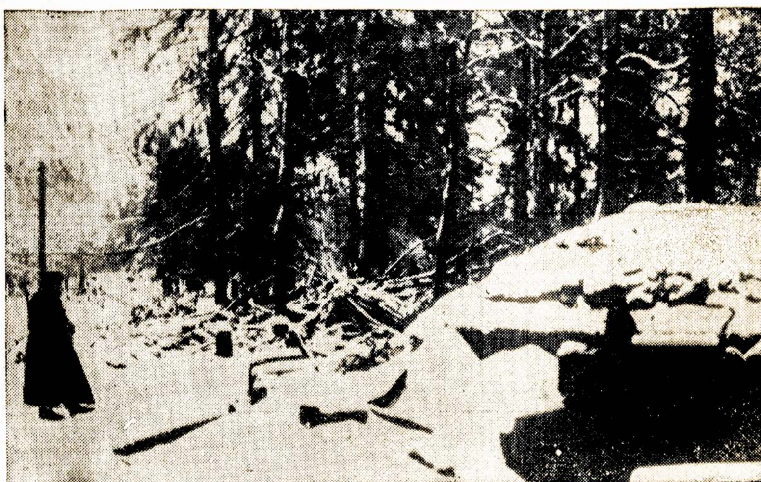
Raudonarmietis stovi sargyboje kažin kur Rytū Fronte.