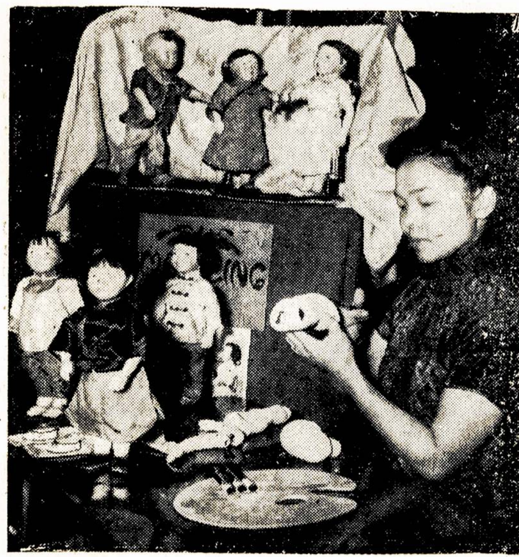
Chinietės Niujorke gamina chiniškas lėles, kurios bus parduodamos ir pinigai, gauti už jas, bus pasiūti Chinijos žmonėms, kovojantiems prieš Japonijos plėšik.