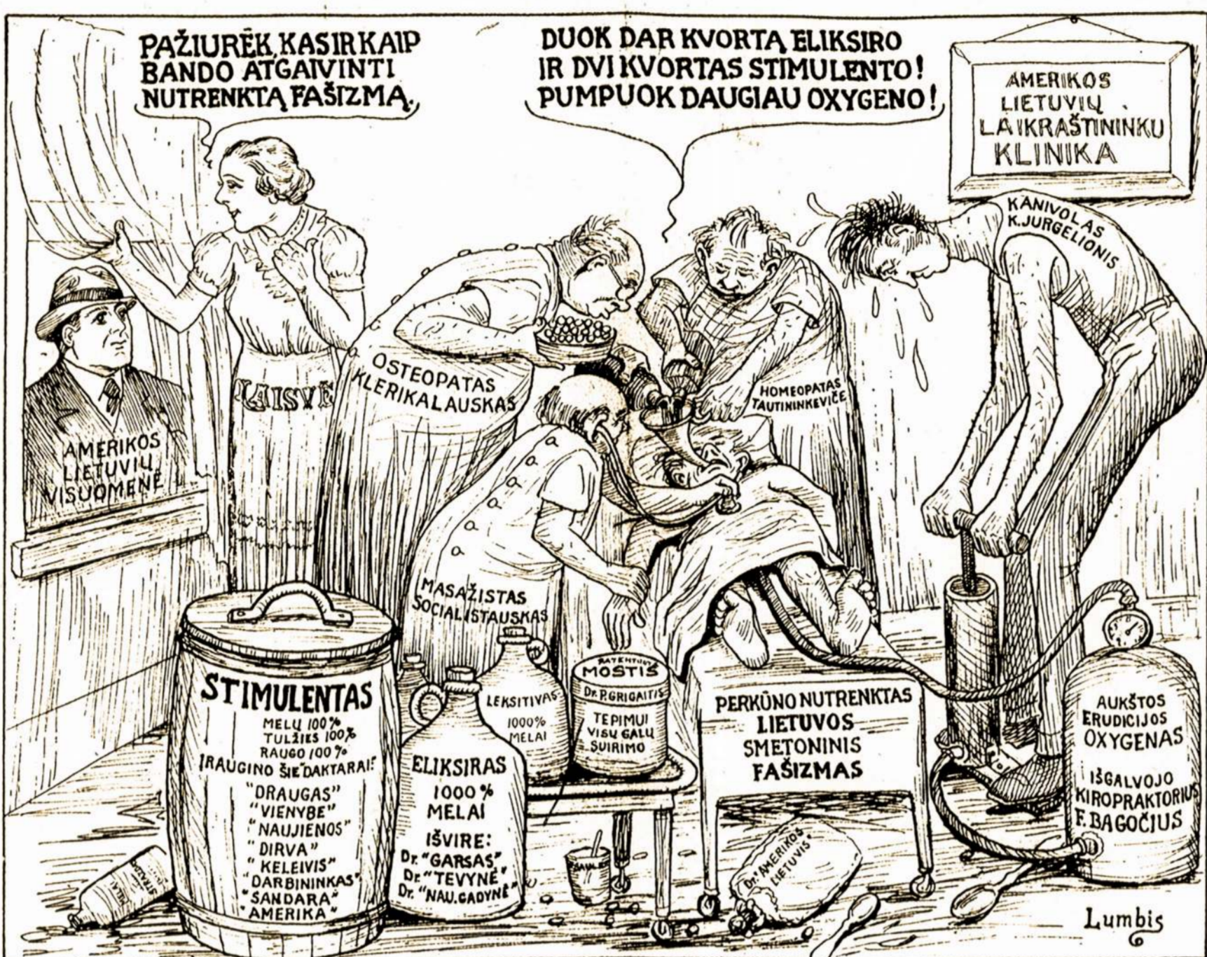
Nepavyks jiems iš numirusių prikelti tą Lietuvos liaudies priešą

Taipgi atiduosime kreditą Bostono kardinolui O' (Tąsa ant 5-to pusl.)