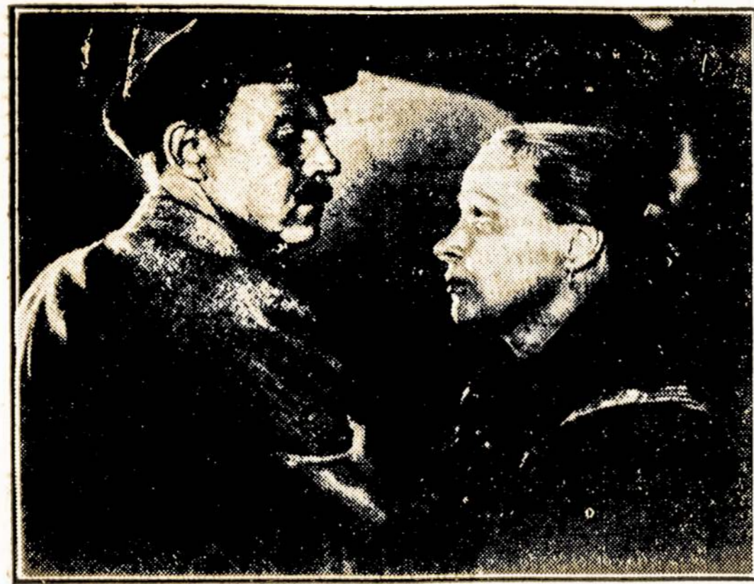
Vaidas iš filmos "The Great Beginning" ("Didžioji Pradžią"), kuri bus rodoma Ironbound Theatre ant Ferry ir Jackson gatvių, Newark. Pradžią balandžio 23 dieną. "Naujoji Latvija" rodoma toje pat programoje.