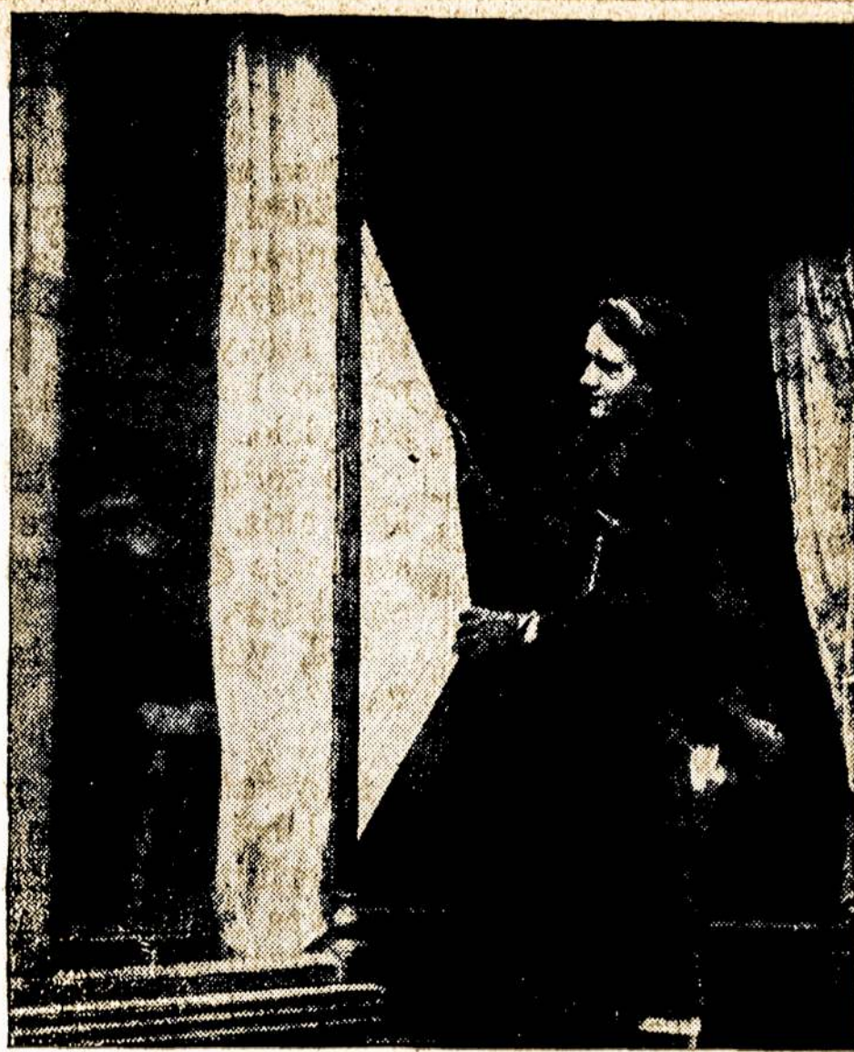
Viename Londono restorane, netoli kurio sprogo bomba, langas išsoko į lauką, paskui ir vėl sumetė atgal ir frėmas pagavo firanką; tarytum kokis stebūklas.