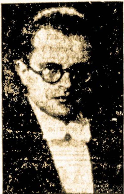
Prof. Vytautas Bacevičius

Visi Great Necko ir jo apylinkės lietuviai prašomi dalyvauti.