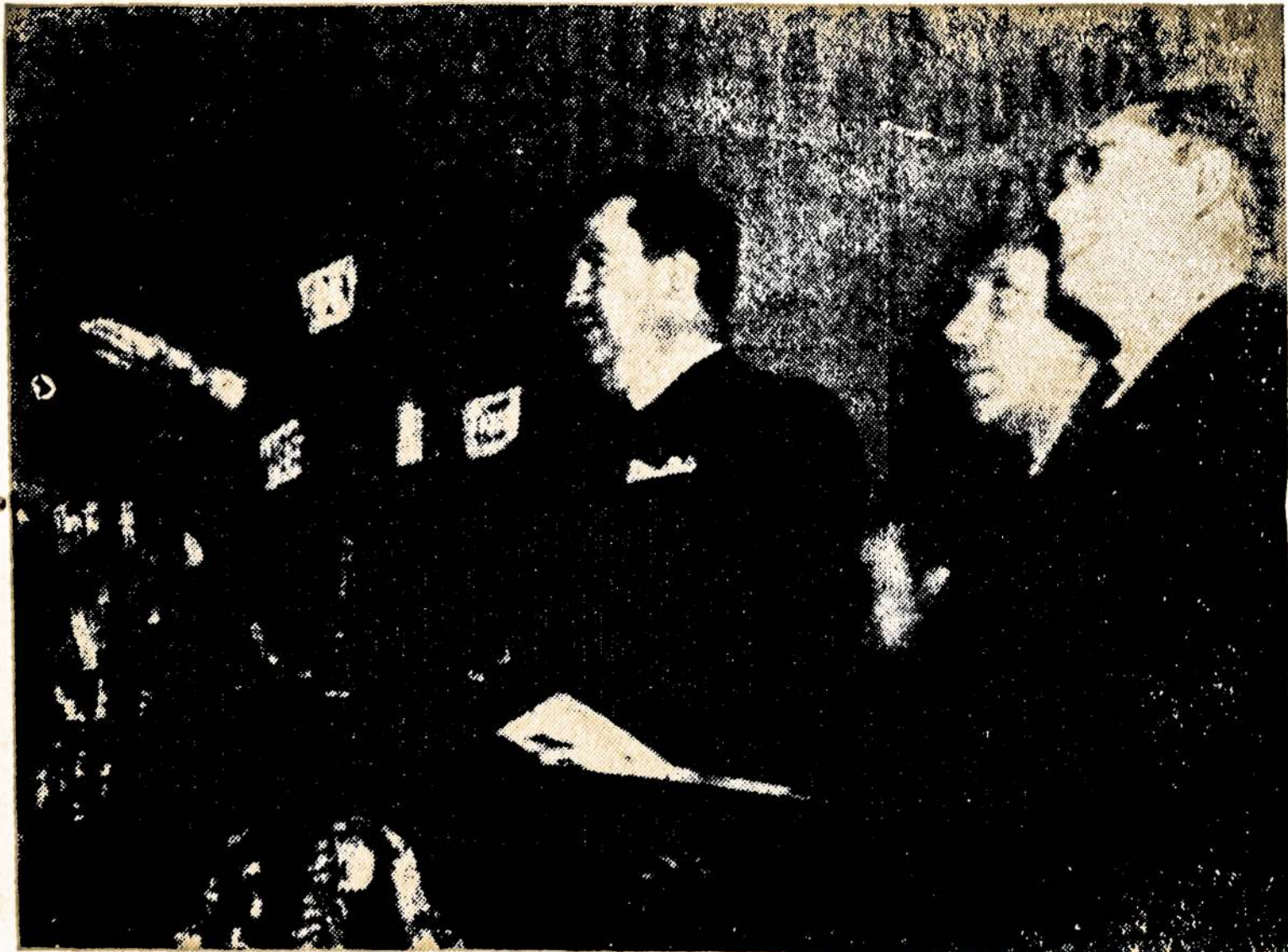
Naujasis Meksikos prezidentas, gen. Camacho, priima prisiega (gruodžio 1 d.), pažadėdamas ištikimai tarnauti Meksikos tautai ir visam kraštui.