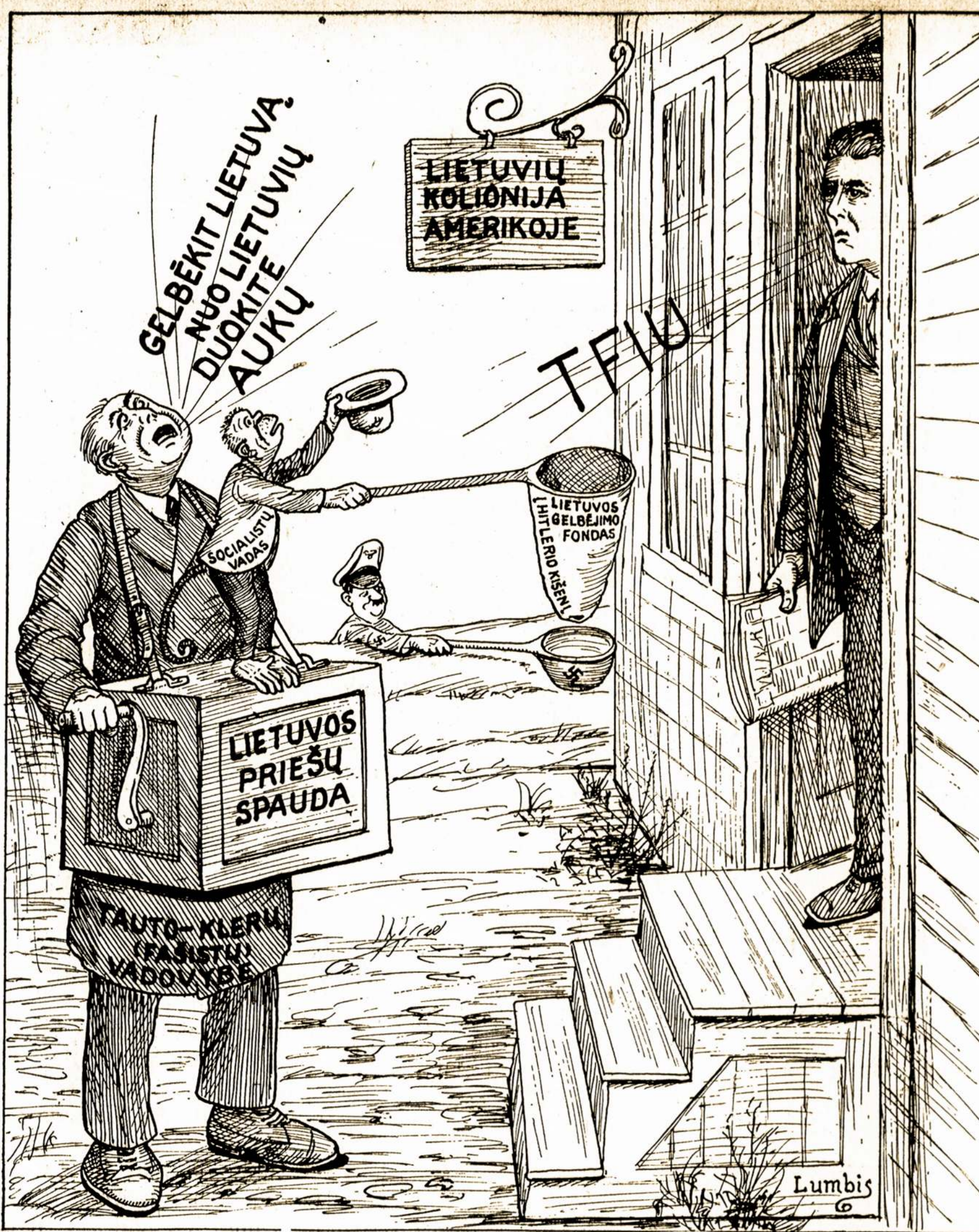
"Tfiu!"—tai gali būti vienintelis susipratusių Amerikos lietuvių atsakymas į fašistų-socialistų-klerikalų prašymus aukoti smetoniškiems žvalgybininkams, pabėgusiems pas Hitlerį.

London, gruod. 10. — Pagal karo teismo sprendimą, anglai nuždė du vokiečius, pas kuriuos rado slaptą radijo perduotuva, per kurį jie davinėjo pranešimus Vokietijai.