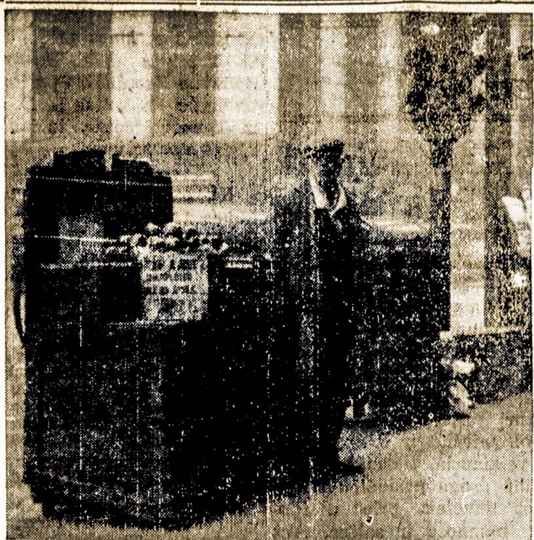
Po pereito karo bedarbis karo veteranas Amerikoje pardavinėjo obuolius gatvių kertėse. Kaip bus su skamuo išaro veteranais?