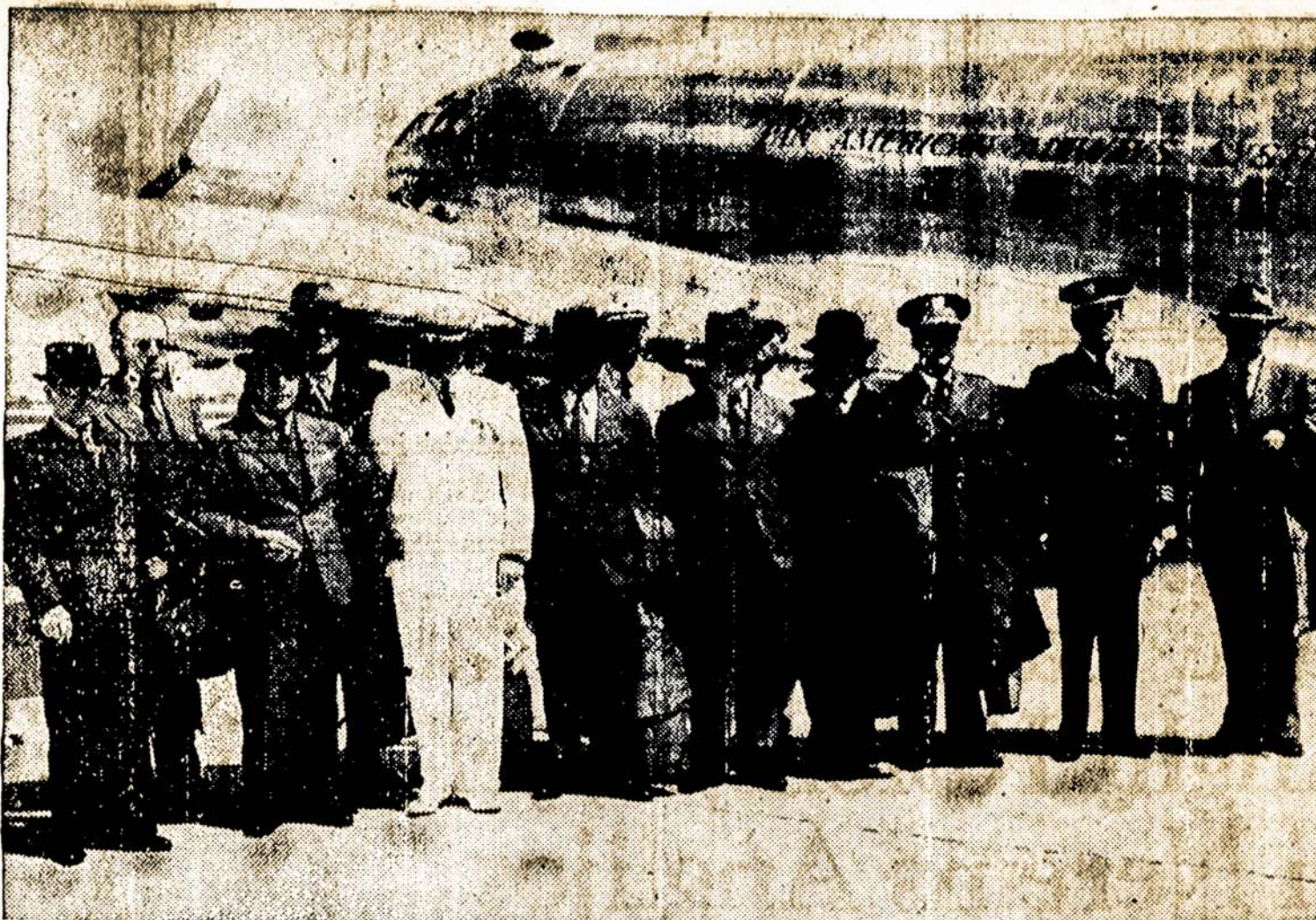
Militarinė misija iš Panamos, Peru, Bolivia ir Colombia respublikų; šie kariai atvyko į Jungt. Valst. pasitarimams dėl bendro apsigynimo.

Kanadoje verstinio karo tarnybon imama vienam mėnesiui, o ne metams. Kanadoje 30,000 vyrų bus paimta verstino karo tarnybon iš 5,000,000 vyrų, esančių tinkamame amžiuje. Na, o Jungt. Valstijose iš 62,000,000 vyrų, esančių tinkamame amžiuje militarinei tarnybai, bus paimta pirmu ėmimu 900,000 vyrų. Jeigu taip yra, tai gan keistai atrodo!