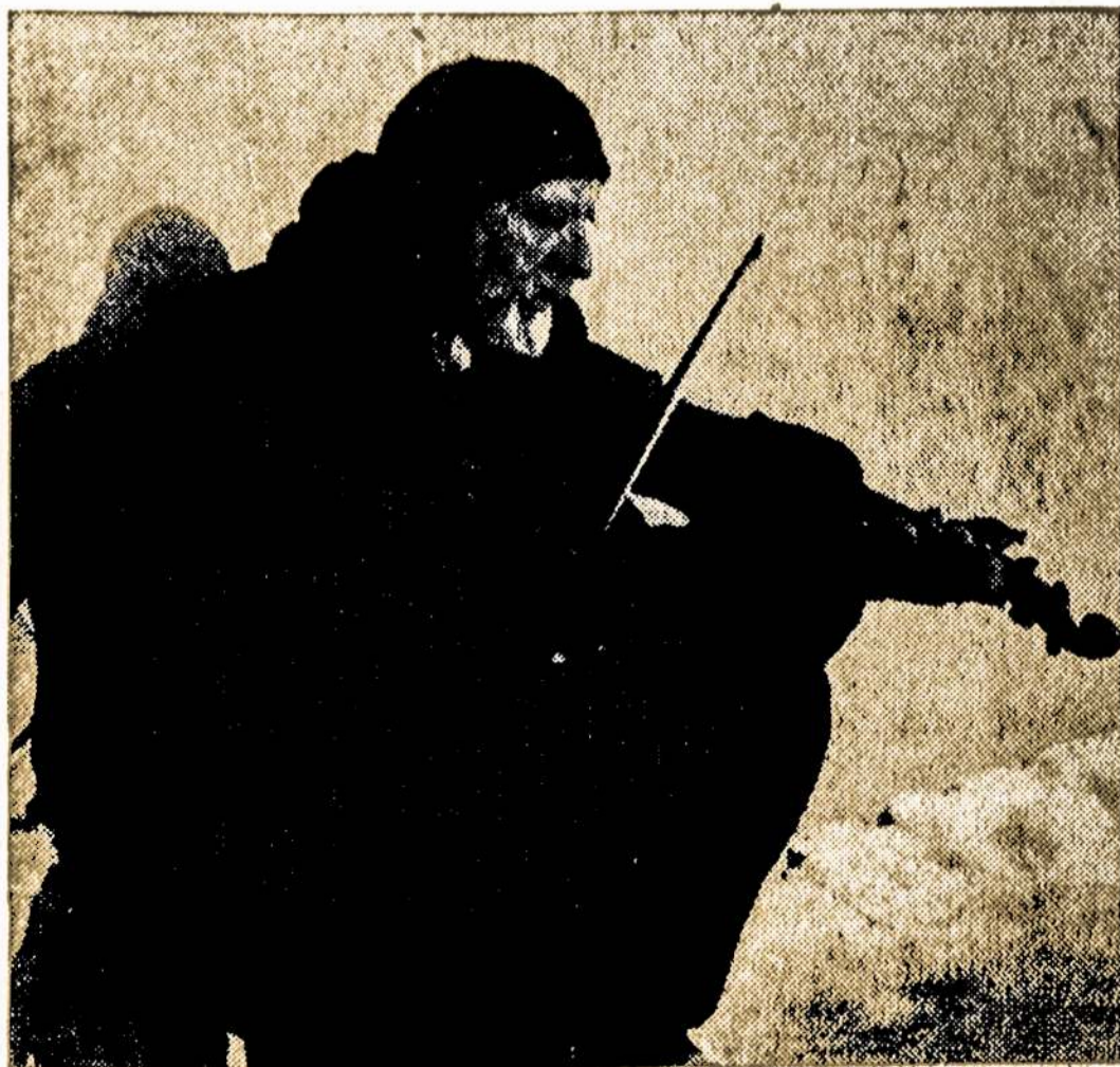
Vilniaus vaizdas: Smuikininkas prie Vytauto Didžiojo Katedros, litų prašo.

Vilniaus odos pramonė turi penkis didžiules įmones ir keletą mažesnių įmonių, kurios per metus pagamindavo apie 2,200 tonų prekių ir duodavo darbo apie 250 darbininkų. Ligšiol vyriausiai jos gamino padus, tačiau po tam tikrų, nelabai didelių techninių įrengimų gali pradėti išdirbinėti minkštąsias odas iš vietinės žaliavos, vadinamąsias juhtas. Galimas dalykas, kad kai kurios žaliavos vis dėlto tektų įsivežti iš užsienio.