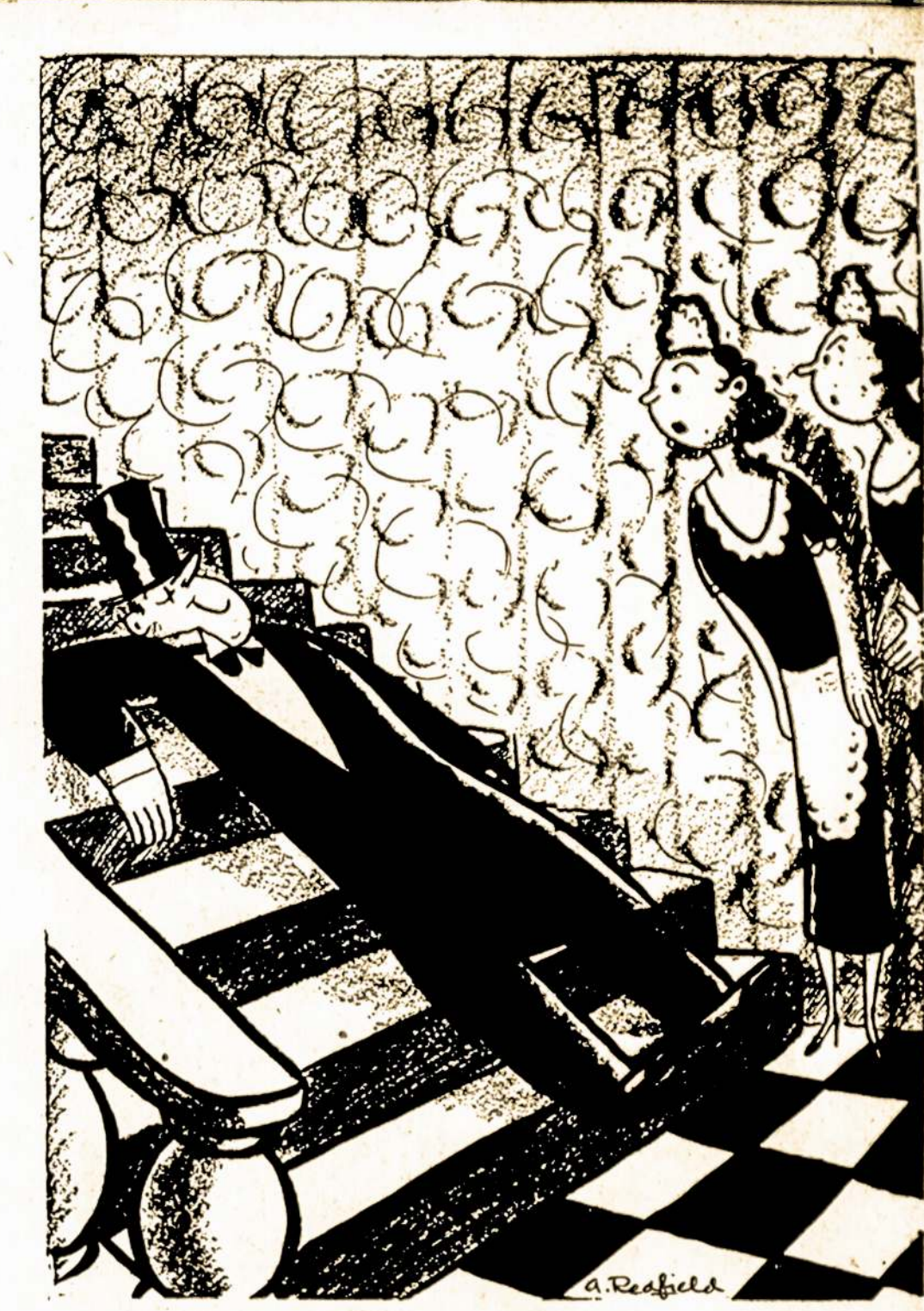
"Was the directors' meeting successful, sir?"

TRAINED bears were taken from town to town in Poland at one time to be used in the treatment of lumbago. It was believed lumbago could be cured by having a bear walk on the patient's back. American cigarettes may be bought in China at half the price that people pay for them in North Carolina where great numbers of cigarettes are made. With women preferring to use the same brands that men do, scented cigarettes, once a big seller among women, have practically disappeared from the market. Mary gazed pensively at the rural scene. "Why are you running that steamroller thing over that field?" she asked. "I'm raising mashed potatoes this year," replied the farmer. "Oh, I see," answered Mary.