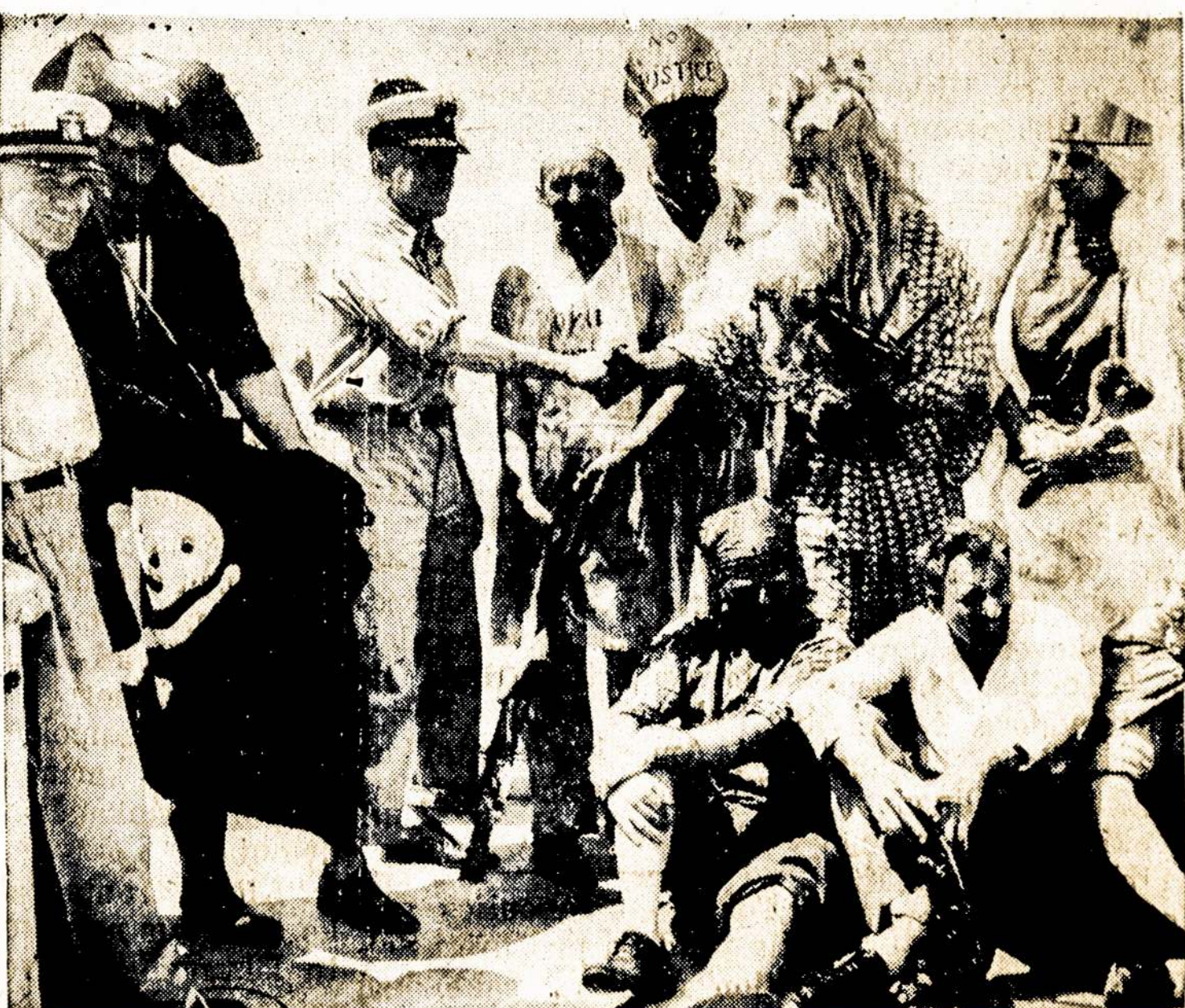
Admirolas Byrd, mokslininkas ir atradėjas, keliauna į Pietų polių; viršų matome, kaip "North Star" laive, jam skersuojant ekvatorių, jūrų karalius Neptūnas sveikinasi su adm. Byrdu.

Pamatingiausia jums bus gauti vitamino B kapsulių: Vitamin B complex capsules. Imkite bent po tris kapsules rytą, pietų ir vakare. Prieš arba po valgio — vis viena, nes tos kapsulės nėra jokis vaistas, o tik sukoncentruota tam tikra maisto dalis (iš kepenų, iš džiovintų mielų bei kviečio grūdo diegų-gemalų). Imkite