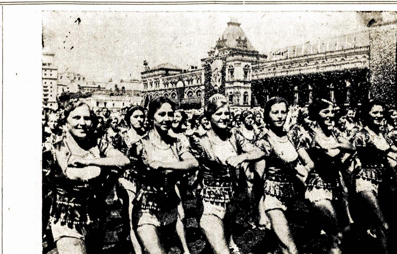
Vaidzas iš Maskvoj atsibuvusio jaunimo fizinės kultūros parado, kuriame dalyvavo virš 25,000 sportininkų ir sportininkių.