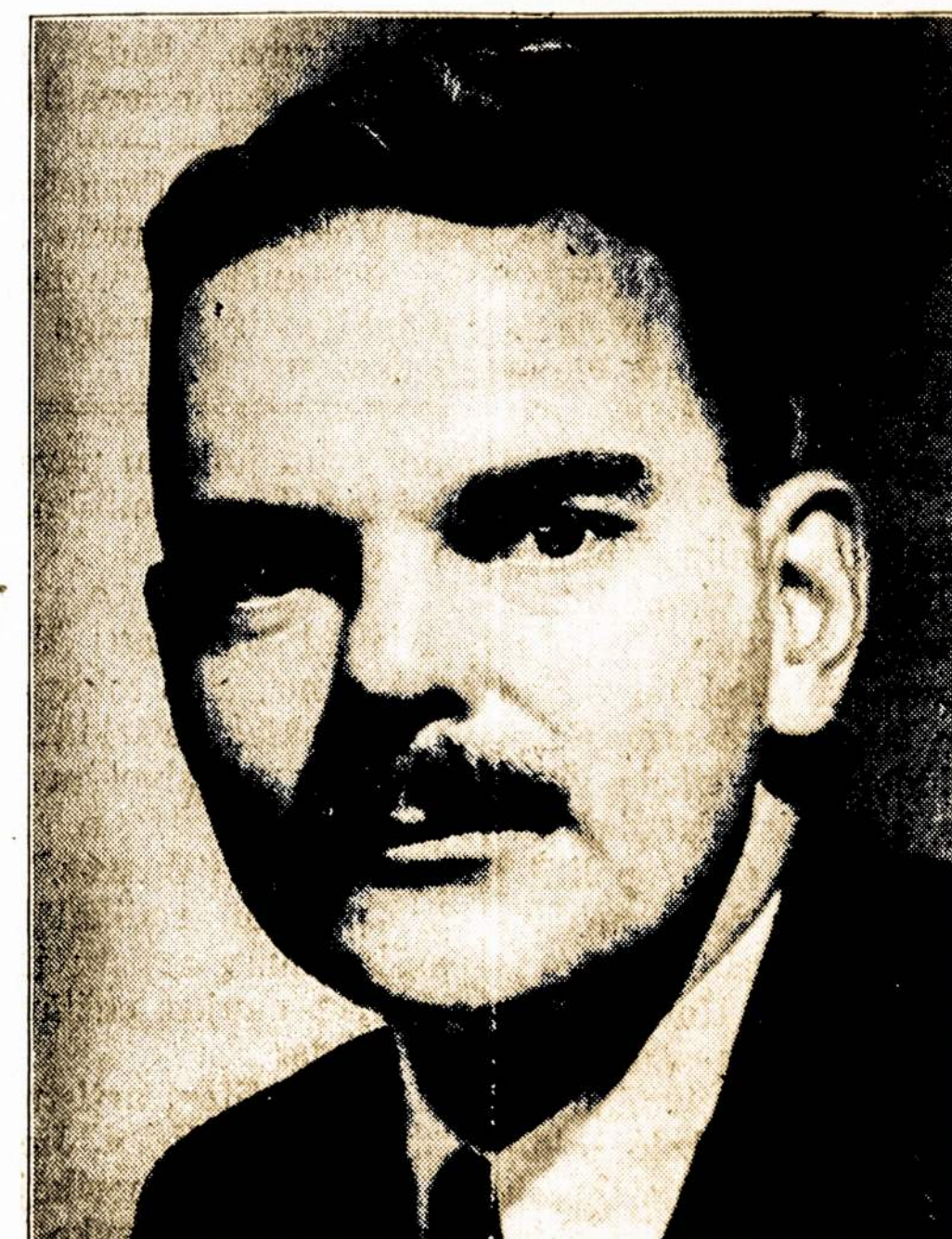
Thomas Dewey, New Yorko apskrities prokuroras.