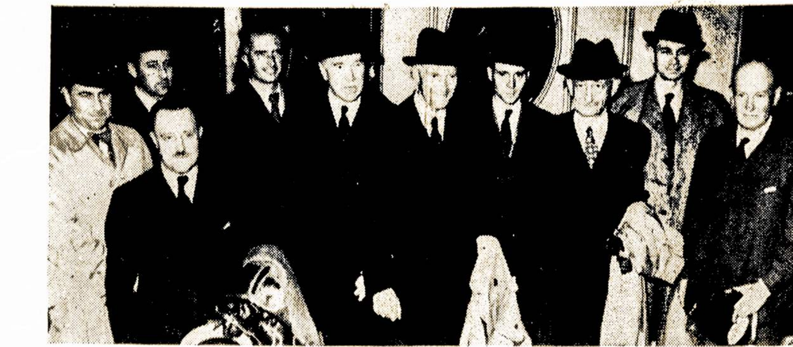
Francijos ir Anglijos didieji karininkai, atvykę į Maskvą derėtis su Sovietų Sąjungos apsigynimo jėgų vadais bendram veikimui prieš fašistus karo agresorius.