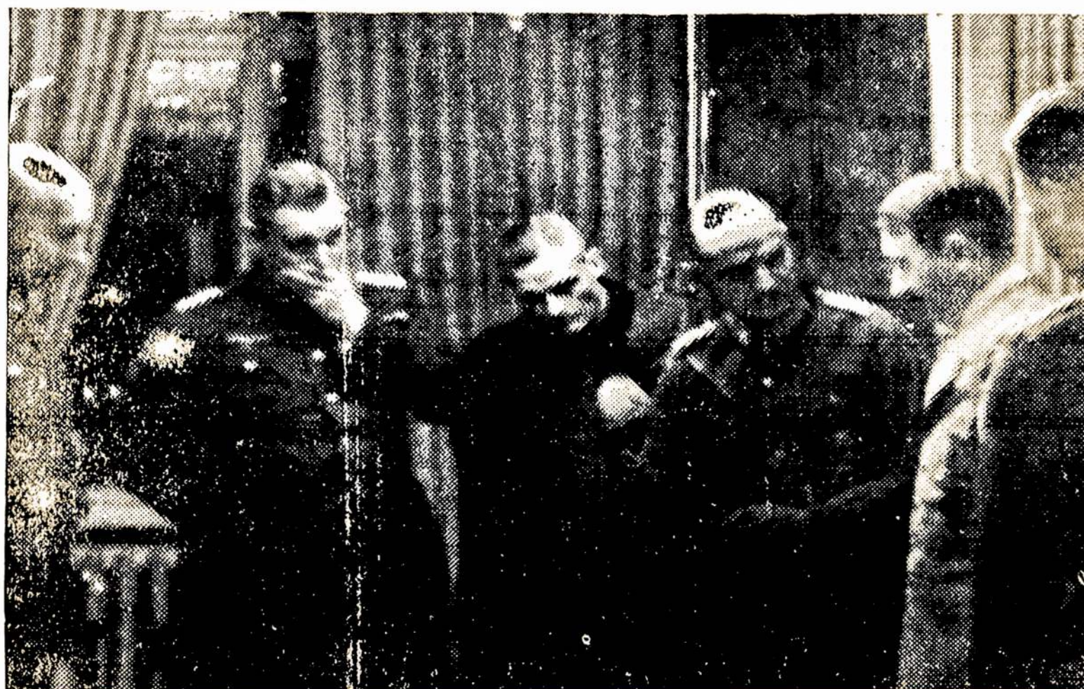
Hitleris Pragoj su savo sėbrais "studijuoja" Europos žemėlapi, mintydamas, kad pirmiausiai reikės nuryti Klaipėdą. Tą jis ir padarė.

97 nuošimčiai Sovietų Ukrainos visų valstiečių, turinčių 99.7 nuoš. visos dirbamos žemės, yra apsvienioje į kolcho-