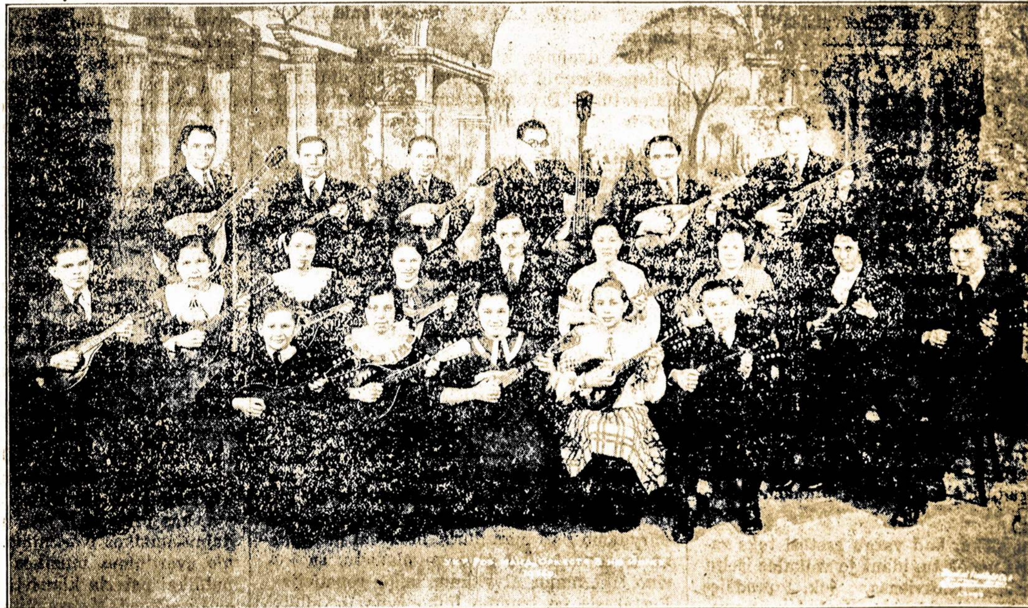
Ukrainų Stygų Orkestra iš New Yorko. Iš jų yra gerų solistų-dainininkų. Skambins rusų-ukrainų liaudies dainas ir kartu dainuos solus.

Jau visai arti, laikas tuojau įsigyti įžangos tikietus.