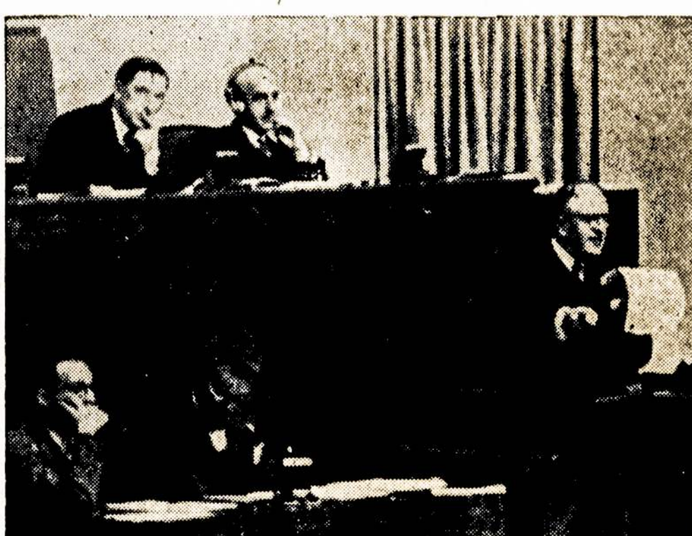
Julio de Vayo, Ispanijos respublikos užsienio reikalų ministeris, sako kalbą Tautų Sąjungos seime, aiškina mas respublikos padėtį.