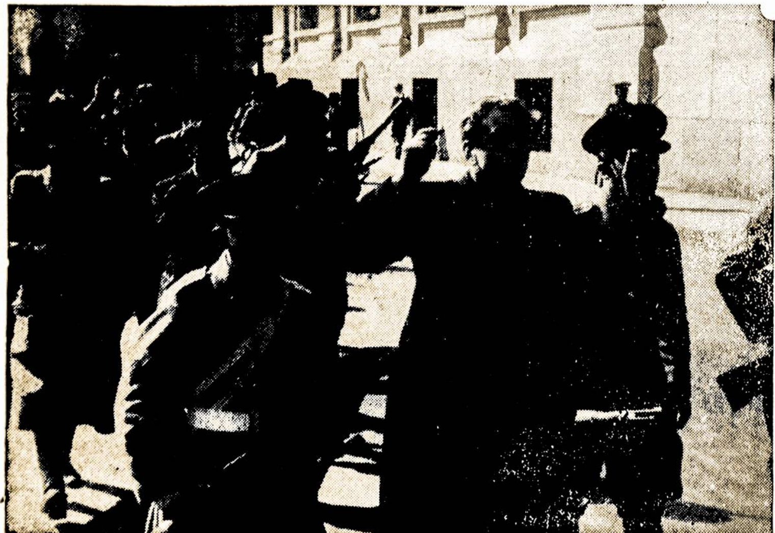
Vaizdas iš nesena likviduoto nazių pučo Santiago mieste, Čilėje.