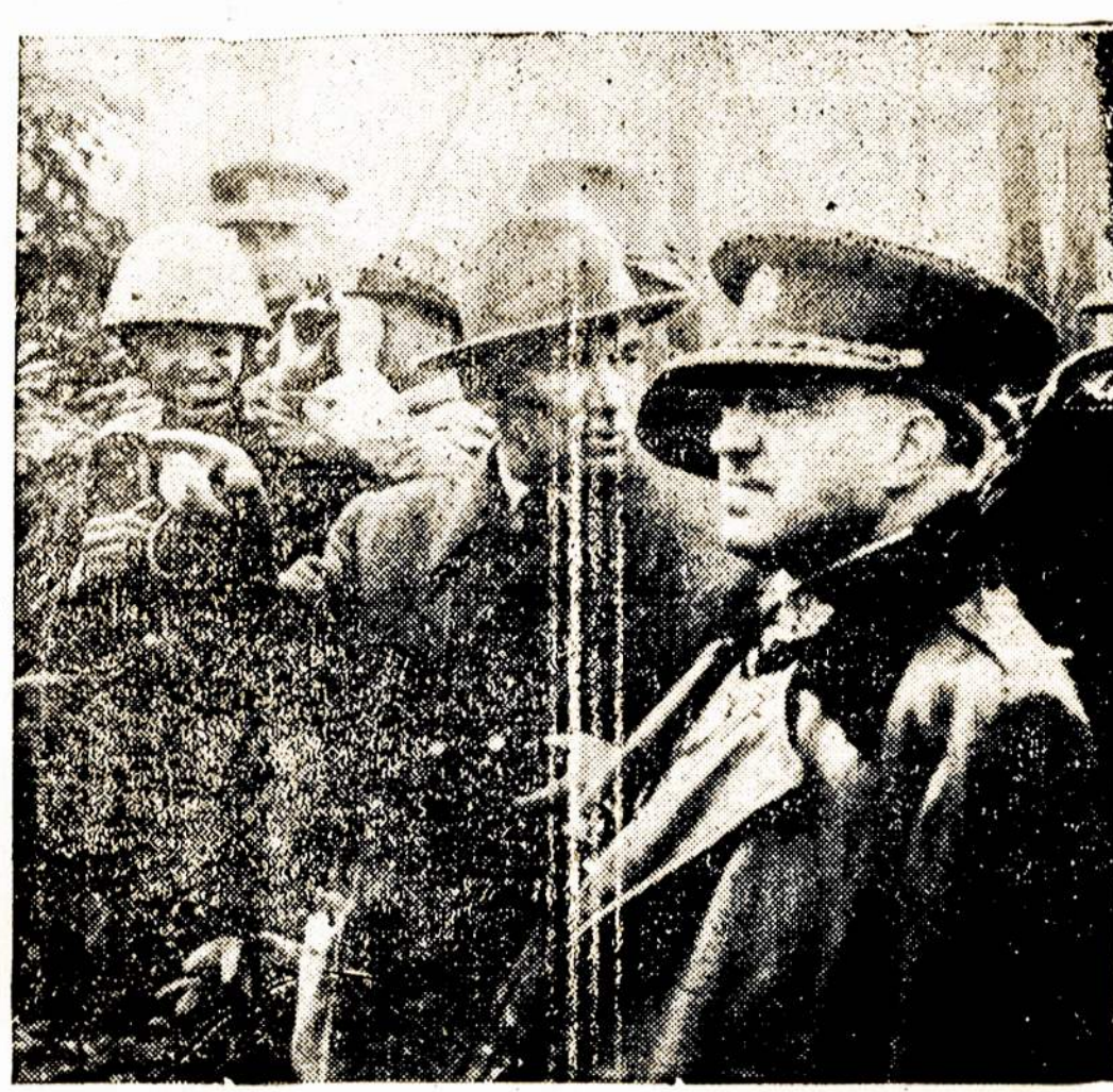
Čechoslovakijos prezidentas Beneš (viduryje) su generolu Kreicium (dešinėje). Ką jie darys, kai naziai, su Anglijos ir Francijos buržuazinių valdžių pagalba, pasirijo jų tėvynę sunaikinti?

Mums, darbininkams, rūpi ir Lietuvos nepriklausomybės gynimas, nes nauja vokiečių ar lenkų okupacija dar labiau padidintų ekonominę ir politinę mūsų krašto liaudies priešpaudą. Užtat mes kviečiam darbininkus protestuoti prieš Smetonos-Mirono valdžios vedamą kapitu-