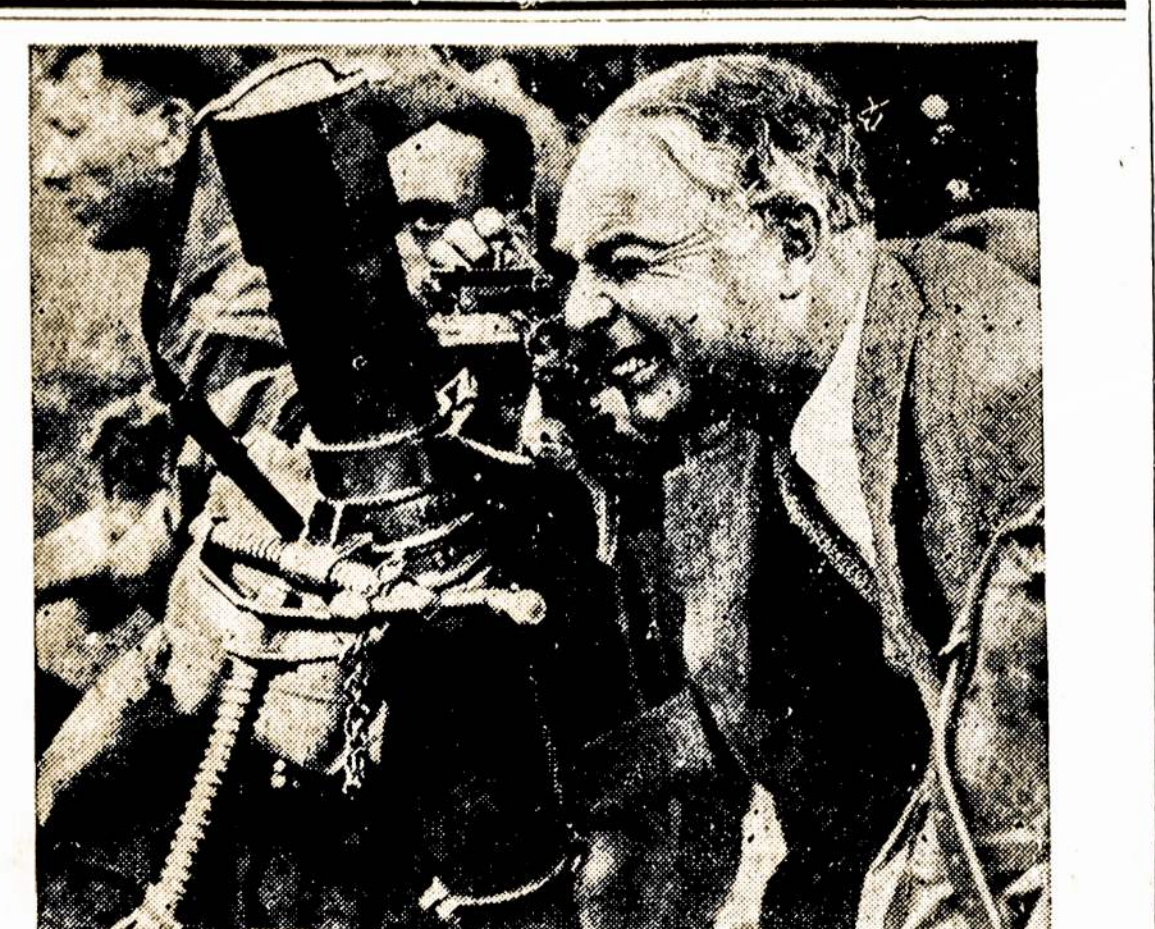
Anglijos karo ministeris Hore-Belisha, kuris neseniai pravedė armijoj dideles reformas, sulgy kuriomis bus įsileista į armijos viršūnes "paprastų žmonių".