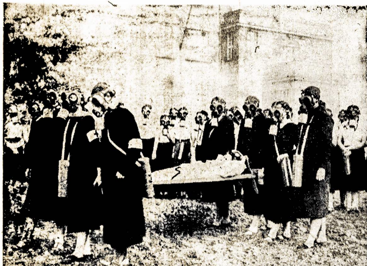
Čechoslovakija nelaukia, kol Hitleris ant jos užpuls; jau dabar žmonės mokinami, kaip vartoti maskas nuo nuodingų dujų apsaugoti; paveikslė matosi, kaip čekai gelbėtų orlaivų kulipkų žneistuosius, jei Hitlerio banditai užpultų ant Čechoslovakijos ir tos šalies žmonės prisieitų gintis.

Čechoslovakija turi 14,729,536 gyventojus. Virš 10% gyventojų gyvena miestuose. Katalikai sudaro 74 nuoš.; liuteronai—7%. Tautiniai gyventojai dalinasi sekamai: čekai sudaro 9,756,600 gyventojų, arba 66 nuoš.; vokiečiai 3,318,445 gyventojus, arba 22½%; vengrai—719,569; ukrainiečiai—568,941; žydai—204,779; lenkai—100,332; cigonai—32,870; rumunai—14,170 pietų-slavai—6,030;