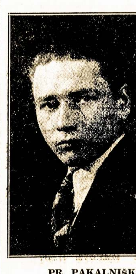
PR. PAKALNISKIS Aleksandro Serjofno rolė "Ar žinau, kas man gresia už tai. Bet niekas pasaulį negalėjo mane sulaukyt žinojimo su tavim, nors ir žinojau, kad tu esi moteris kito... jeigu jau likt arštuotu ir kanjintis retėziuose, tai bent arti tavę, arti tos, katrą aš niekad nepaulyčiau mylėjes ir nepalūsausiu... Na, o tu, Verute, ar laiminga?.."