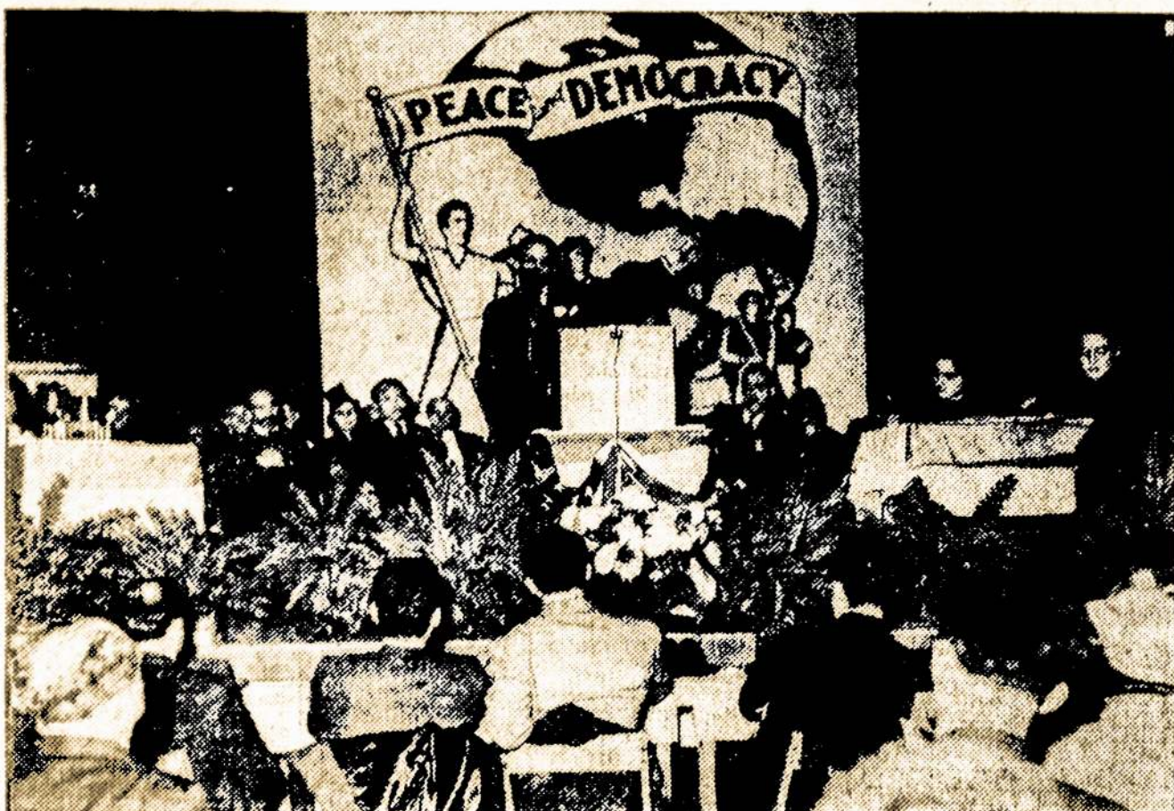
Vaizdas iš Kongreso už Taiką ir Demokratiją, įvykusio Pittsburghe, kur buvo atstovaujama apie 4,500,000 organizacijų narių.

"LAISVĖ", 427 Lorimer Street, BROOKLYN, N. Y.