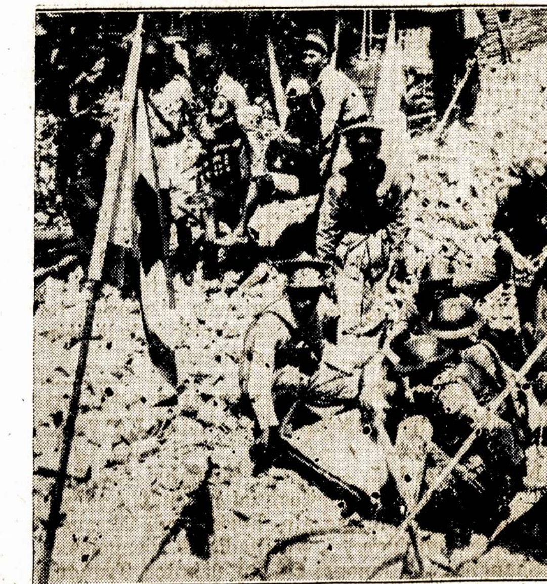
Činijos Raudonojo Kryžiaus pirmoji pagelba žmonėms, kur japonai iš lėktuvų bombardavo 500 sv. sunkuoms bombomis.

Shanghai, gruod. 3. — Į Shanghaius Tarptautinę Dalį ir Francūzų Koncesiją yra sugužėję iki 3 milijonų chinų, dauguma jų—pabėgėliai nuo japonų. Štai kodėl japonai daro provokacijas, įieško kablukų, idant užimt tas svetimsalių valdomas miesto dalis.