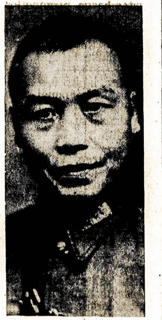
Činijos Kwangsi provincijos generalas Li Tsung-jen. Jis siūlo Nankingo valdžiai tris milijonus vyrų karių prieš Japoniją. Jo komandoje randasi 200,000 armija.