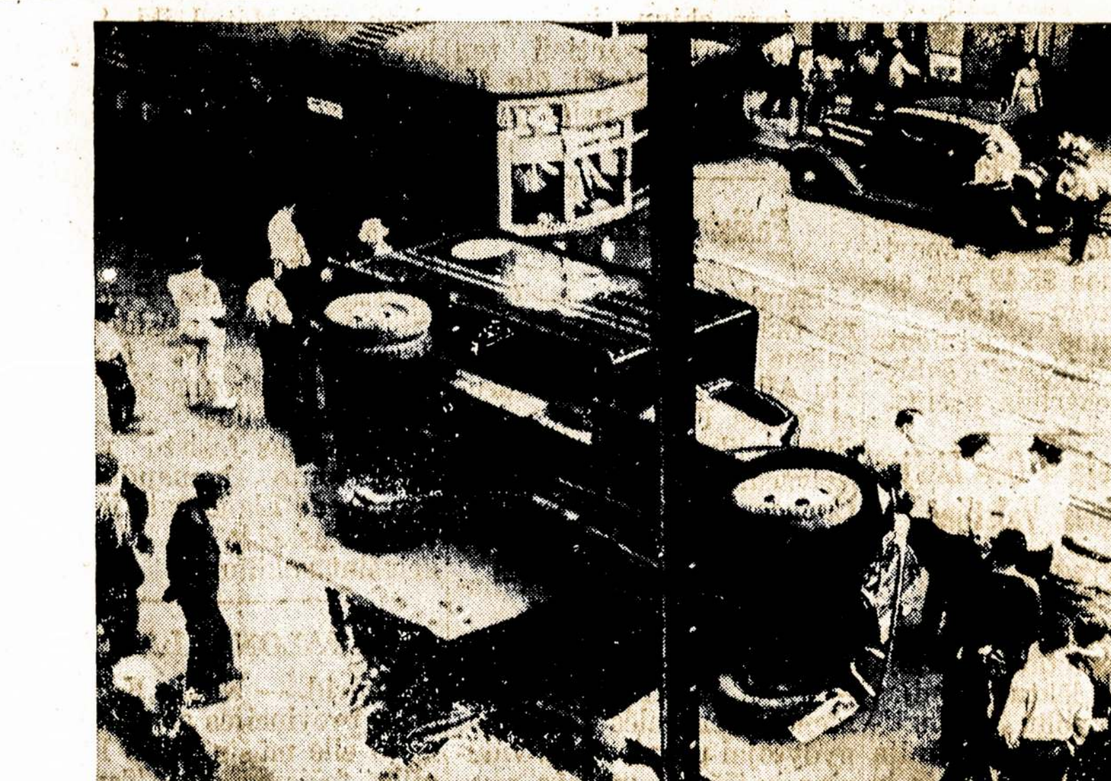
Scena iš Buffalo trokų kėravotojų streiko. Kadangi darbininkai gerai laikėsi, tai samdytojai buvo priversti pripažinti jų reikalavimus ir streikas tapo užbaigtas.

Keliose apskr. vietose šiemet daromi dideli nusausinimo ir keturių upelių sutvarkymo darbai. Bus sutvarkyta Kražantės, Grįžuvos, Mūkės ir Luknės upės. Nusausinimo darbus prižiūri 8 kultūrtechnikai. Prie šių darbų dirba daug darbininkų.