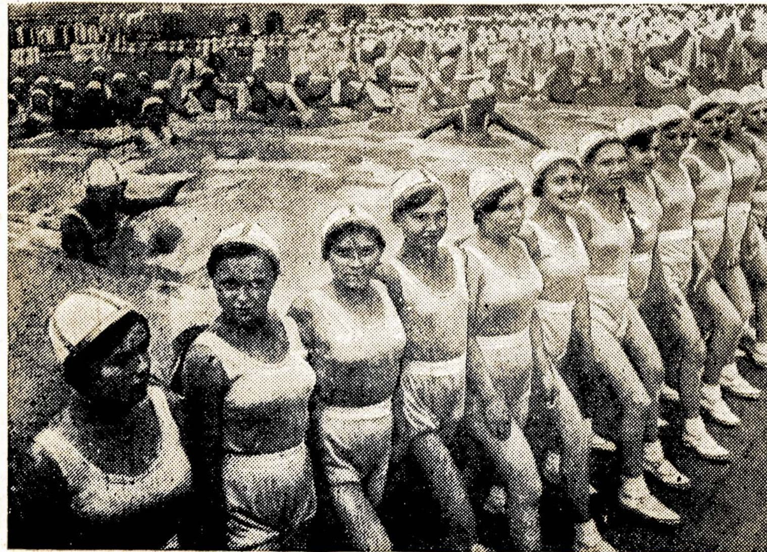
Sovietų Sąjungos atletės žygioja sporto dieną per Raudonąją Aikštę, Maskvoje. Jos neša mėlyną, vingiuojančią palą, kuri atrodo tarytum maudymosi prūdas. Ar ne puikios socializmo šalies atletės?

„LAISVĖ“ 427 LORIMER ST., Brooklyn, N. Y.