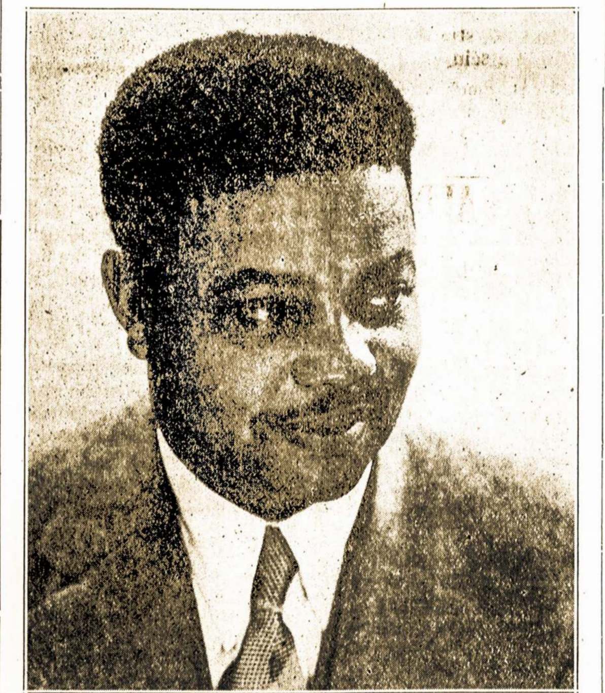
J. W. FORD, Komunistų kandidatas į Jungt. Valst. vice-prezidentus.