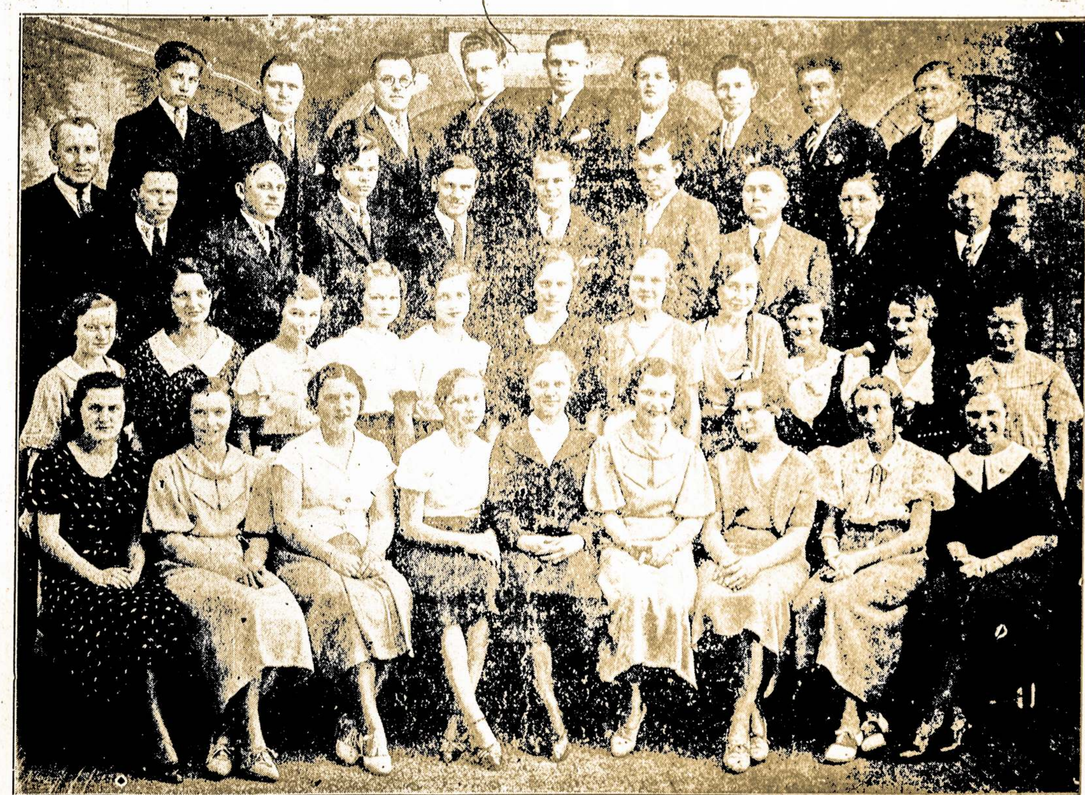
Laisvės Choras iš Hartfordo

Rengia Conn. Valstijos A.L.D.L.D., L.D.S. ir L.M.S. Apskričiai Įvyks Nedėlioj, 13 d. Rugsėjo-Sept. LIETUVIŲ PARKE (Sta. 24 Glastonbury Line) E. HARTFORD