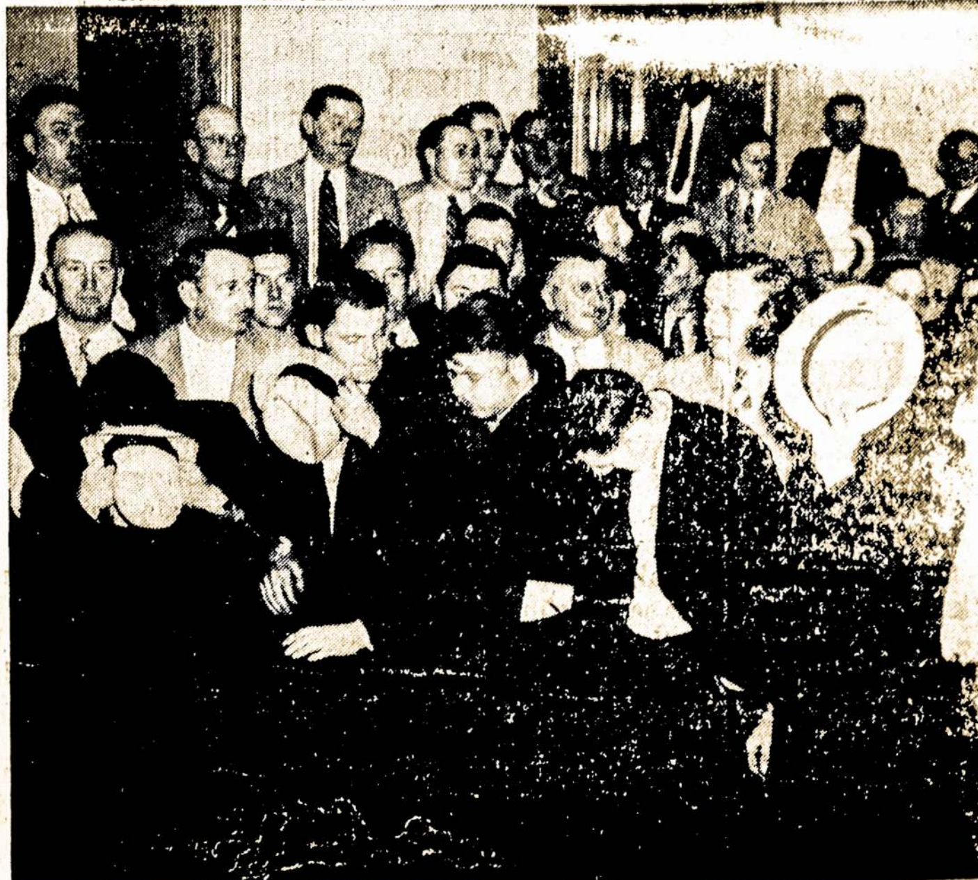
Juodojo Legiono nariai, teroristai, suimti Detroito