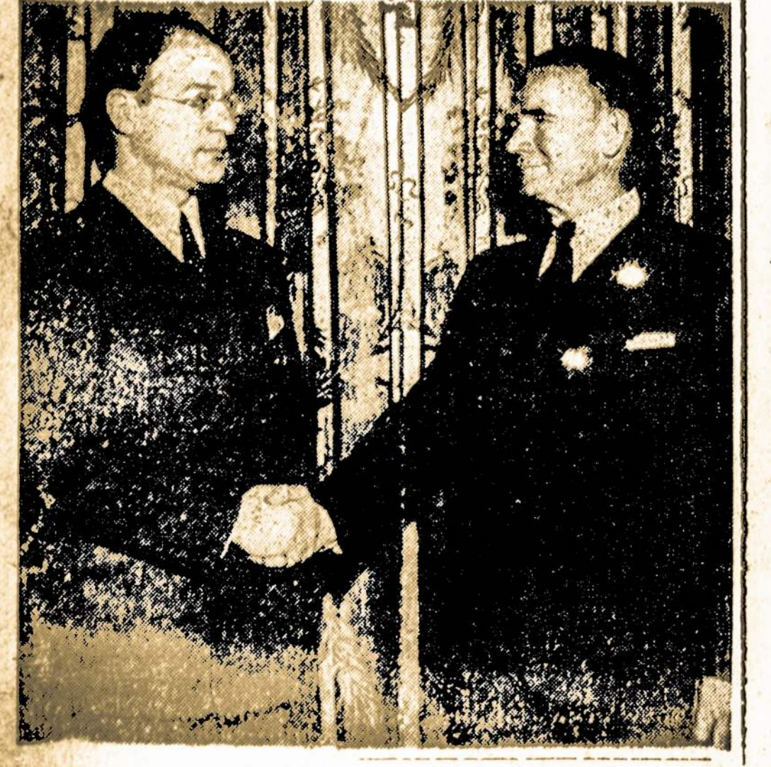
Amateur Athletic Union (Mėgėjų Atletų Sąjungos) buvęs prezidentas (deinėj) J. Mahoney, kratosi ranka su esamu prez. Brundage. Pirmasis smarkiai kovoją prieš amerikiečių dalyvavimą olimpijodoje Vokietijoje.