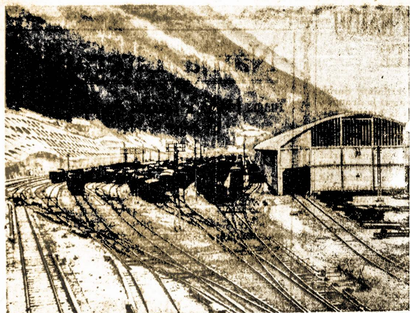
Geležinkelio stotis Italijoje, kurioje matome vagonus, pilnus aliejaus, pargabento iš kitų Europos kraštų. Be aliejaus Italija negalėtų kariauti, bet sankcijos kol kas dar vis nevykinamos aliejaus klausimu.