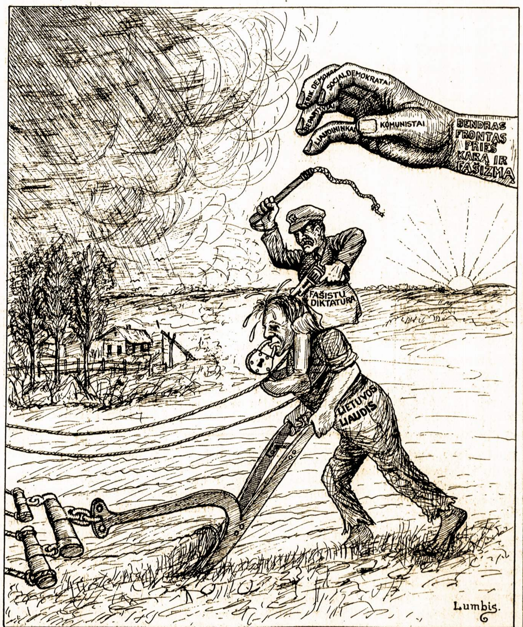
Padėkit jam nusikratyti nuo sprando tą parazitą!

ROMA.—Po fašistų Didžiosios Tarybos susirinkimo, Mussolinio valdžia gruodžio 20 d. paskelbė, kad Italija "su nepalenkiamu pasiryžimu sieks savo tikslo," kas liečia Ethiopijos nukariavimą.