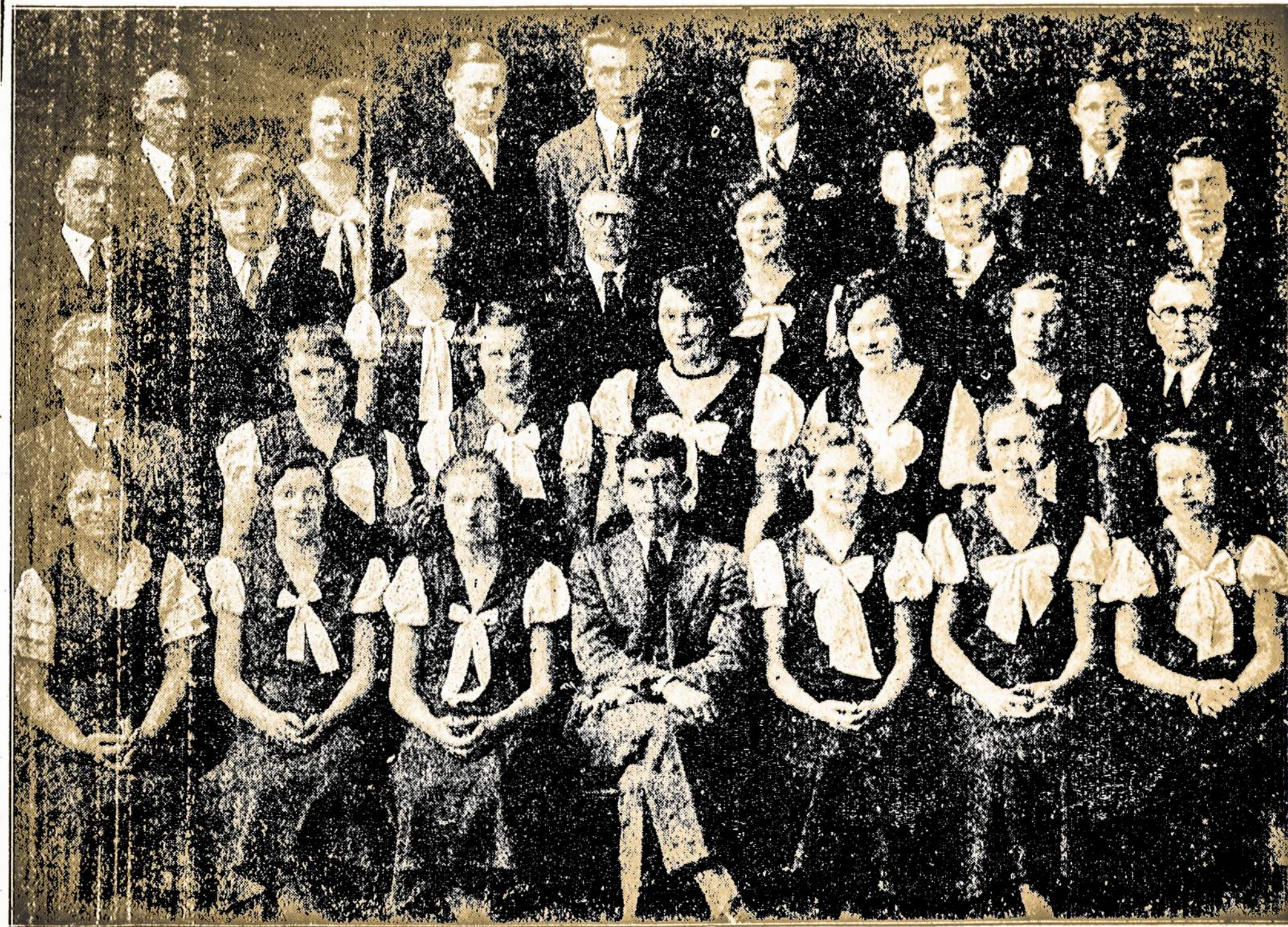
Vilijos Choras iš Waterbury, Conn.

Šokiams Graįys Merrymakers. Or kestra nuo 12-tos valandos dieną iki vėlai vakare.