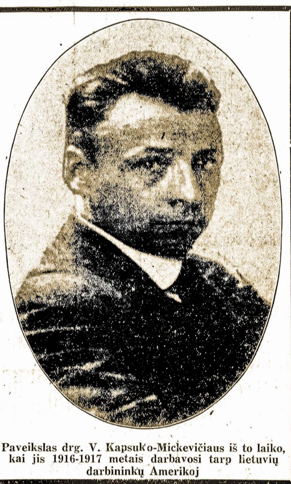
Paveikslas drg. V. Kapsuko-Mickevičiaus iš to laiko, kai jis 1916-1917 metais darbuos tarp lietuvių darbininkų Amerikoje

Kalėjimo viršininkui daugelis smalsių žmonių prisuntė prašymus, kad leistų jiems matyti, kai Hauptmannas bus žudomas elektros kedėje. Bet Hauptmanno advokatai ruošia apeliaciją augštesniam teismui, idant išsukt jį nuo baumės.