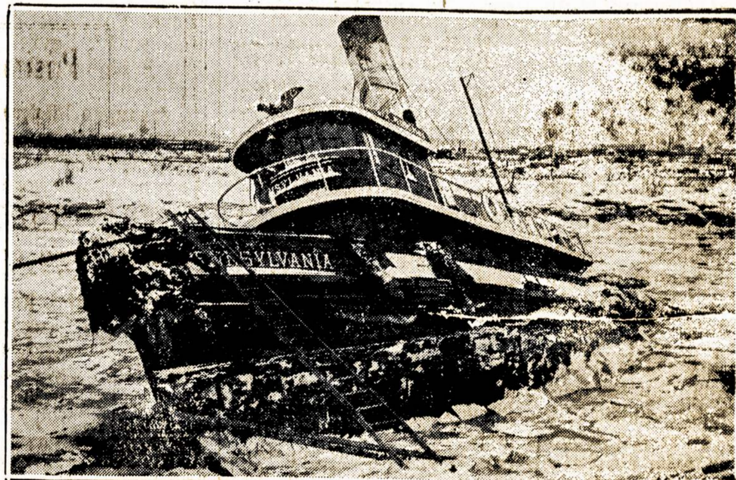
Laivelis Pennsylvania, nuskendęs Cooper upėje, Camden, N. J. Įgula tačiau išsigelbėjo.

Be artimesnio asmeninio patyrimo nėra galima kas tikrai tarti. Galima daryti kelios bendros pastabos.