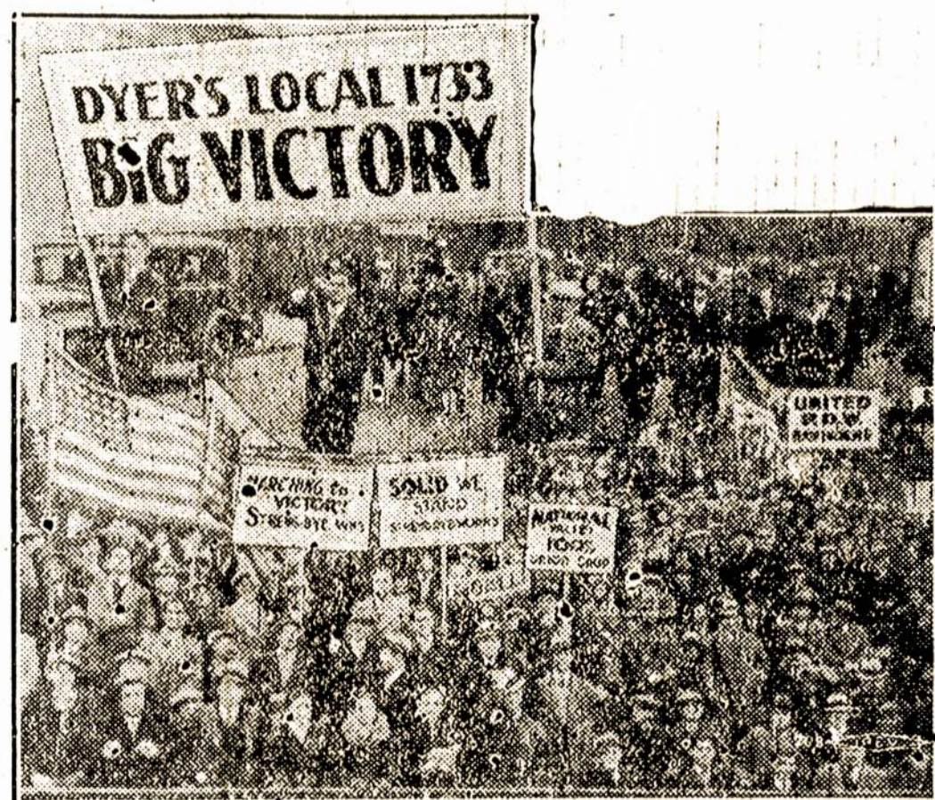
Vaidelis iš to, kaip Patersono šilko dažytojai apvaikščiojo užbaigą savo 6 savaitių streiką, kurį jie žymia dalim laimėjo.

Paskutiniu laikų girdėjau, kad Valentukoniai prisirašė prie ALDDL kuopos! Mūsų draugų darbas per ateinantį ALDDL vaju turėtų būti duoti daugiau, siai pagelbos bedarbiams įstoti mūsų apšvietos draugijon!