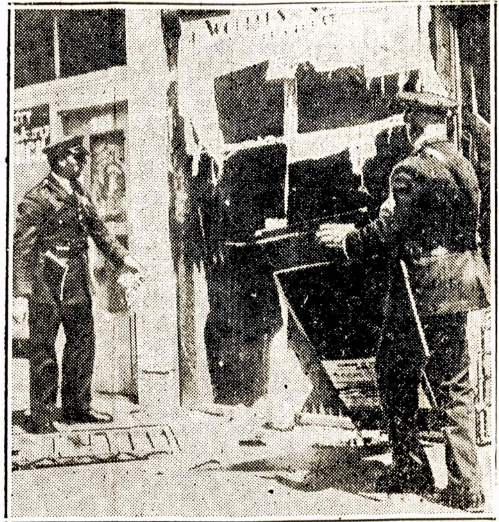
Vaidelis parodo, kaip fašistinės govėdos ir policija suardė San Francisco finų darbininkų kooperacijos patalpą. Panašiai išgriovė komunistų, I.W.W. ir net Darbo Federacijos unijų centrus.

TD Apsigygnimas traukia tiesos ir padaužas, kurie išardė, išdaužė darbininkų centrus. Reikalauja apmokėti už padarytą žalą.