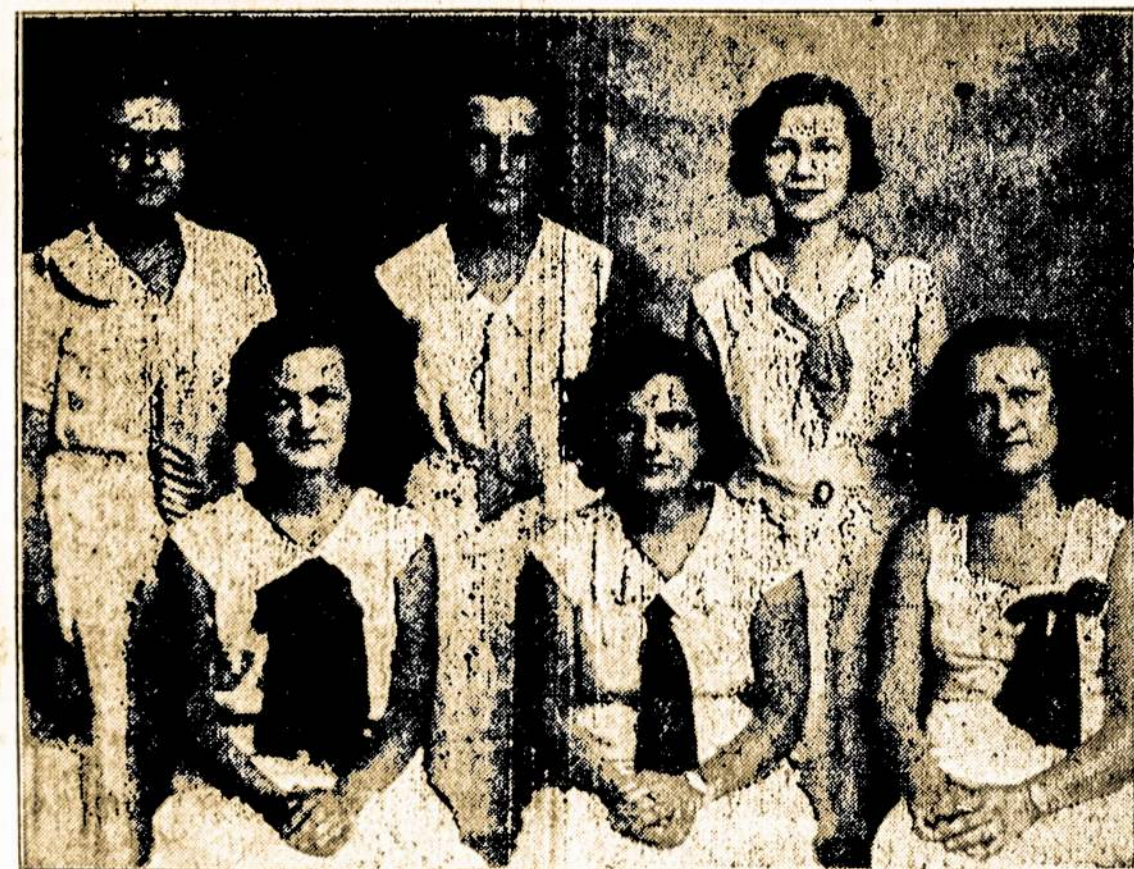
Merginų Sekstetas iš Brooklyn, N. Y.